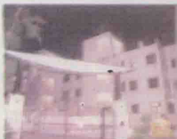
曾属张子强的南湾道一豪宅单位。