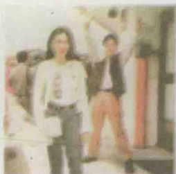
张子强与妻子的合影