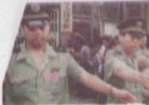
1998年10月20日-27日,张子强案在广州中级人民法院一审完毕,11月12日公开宣判。