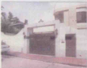
九龙塘金巴伦道二十八号以超低价三千万卖出