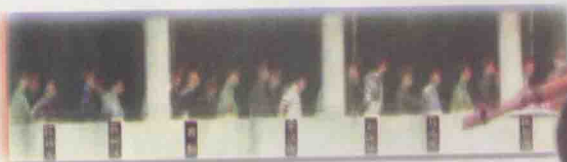
张子强团伙重犯被押往法庭时的情景