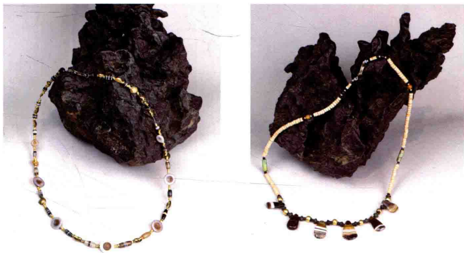
仿华鬘形制的现代文玩颈串

璎珞和华鬘以佛教尊像饰品为始，逐渐演变成佛教文化华贵、庄严的装饰品，与佛珠有着异曲同工之妙。但相较之前两者，佛珠更则显得朴素无华，其佛意也更为深邃。