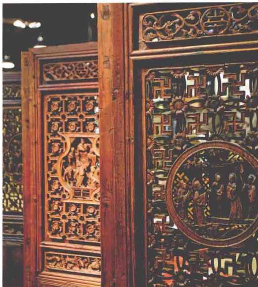
◎ 雕花窗格被改良成为屏风，通透而美观，打造出既有遮挡又有开放感的空间

一般而言，中式家具可分为三种：古董家具、仿古家具及老件新作。目前的古董家具大部分来自北京、浙江、广州、福建及山西等地，朝代追溯到清末民初，各地的特色不尽相同。仿古家具则是以现今材料仿制明、清两朝家具的明式家具和清式家具。老件新作则是将古董家具改良，加入现代实用功能。