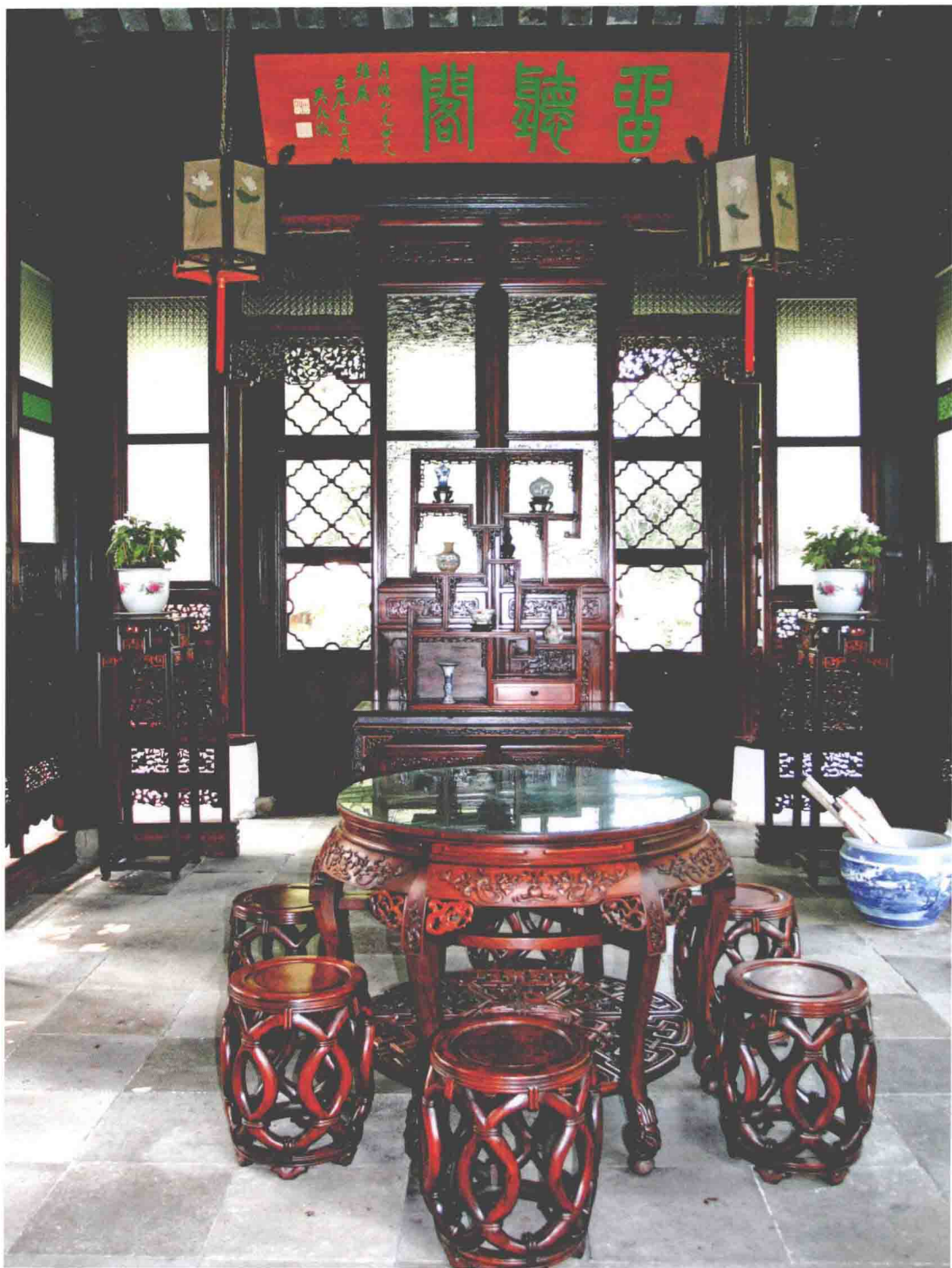
◎ 苏州拙政园留听阁陈设的家具