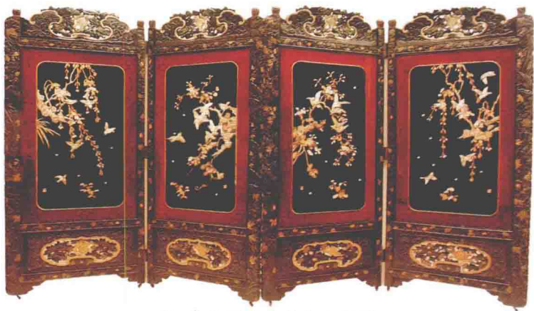
◎ 清代百宝嵌花鸟纹围屏