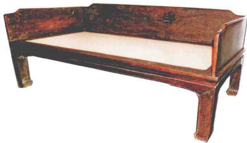
◎ 明末清初鸡翅木三围罗汉床

床榻是历史较为悠久的卧具。榻，指只有床身，没有围子和其他装置的卧具，较窄，一般专供休息与待客。榻类家具主要有罗汉榻、贵妃榻。床一般指睡眠用的卧具，常见的床类家具有拔步床、架子床、罗汉床等。