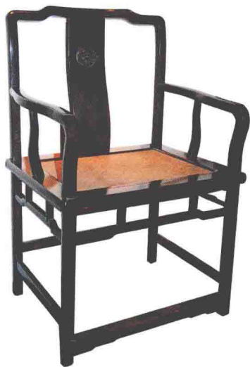
◎ 清代紫檀木南官帽椅

椅凳是常用的坐具。椅是一种有靠背和扶手的坐具，凳没有；在形制上，椅比凳小；凳类家具有机凳、方凳、条凳、圆凳等，实用性强而无装饰性；椅类家具常见的有交椅、圈椅、靠背椅、官帽椅、玫瑰椅、扶手椅、太师椅、宝椅和宝座等，其用料考究，制作精湛，融实用与装饰于一体。