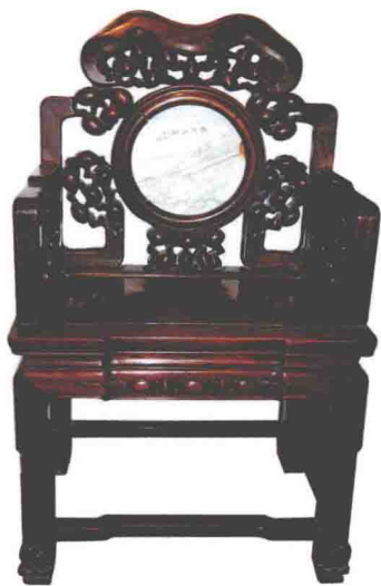
◎ 清代嵌云石广式扶手椅

“广”指清代广州地区。广式家具用料粗壮，造型厚重，用料清一色，互不掺用，气度豪华气派。在结构、造型和装饰上，广式家具受西方建筑装饰风格影响较大，多为中西合璧之作。值得一提的是，广式家具中的镶嵌技艺独步一时，堪称一绝。