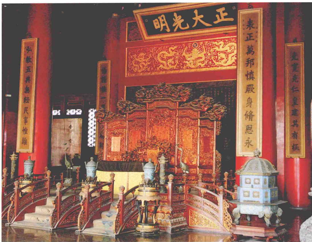
◎ 北京故宫中的龙椅和屏风