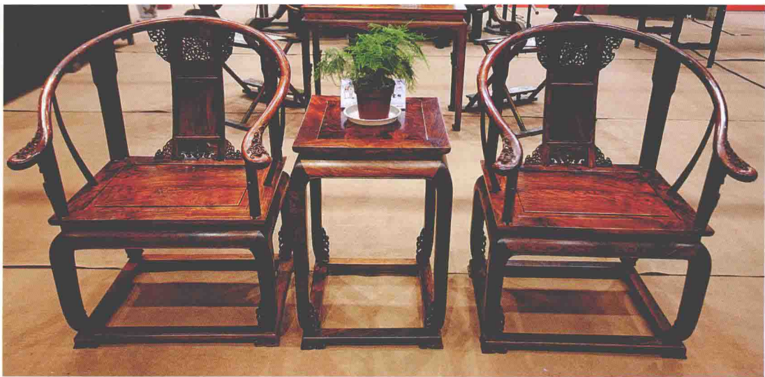
◎ 明式黄花梨木圈椅