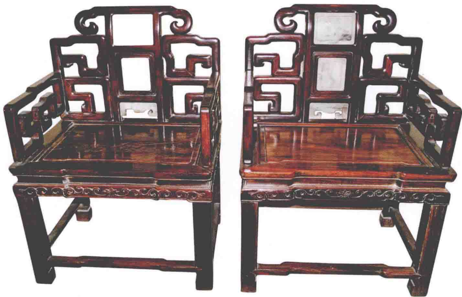
◎ 清代中期苏式家具红木扶手（太师）椅

“苏”指清代苏州地区。苏州是明式细木、红木家具的发源地，其家具精于用材，做工精巧，器形有文人气质，线型流畅，比例适度。大件家具多采用攒斗、包镶工艺，小件更是精心琢磨。清代中期起，形成苏式家具风格，有些家具转向富丽豪华。