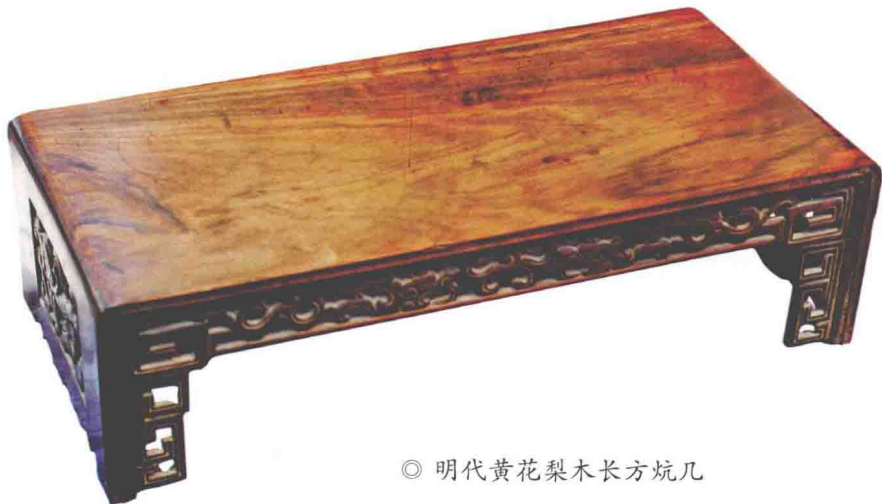
◎ 明代黄花梨木长方炕几