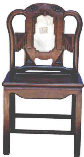
◎ 清代红木广式单靠椅

“京”指清代北京地区。清代宫廷造办处制作家具，主要是以紫檀、黄花梨和红木等材料为主，并不惜工本和用料，装饰力求华丽，多镶嵌金、银、玉、象牙、珐琅、百宝镶嵌等珍贵材料，使京式家具形成了气派豪华、工艺奇巧的特点。