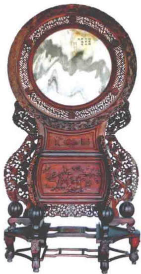
◎ 清代红木灵芝八仙地屏

屏架是屏风与架子类家具。屏风是用来分隔空间、挡风和遮蔽视线的家具，包括折屏、座屏、插屏、挂屏等。架类家具是古代家具中带有装饰性的实用家具，常见的式样有书架、衣架、脸盆架、博古架等。