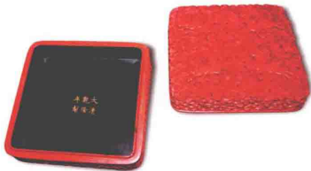
◎ 清代乾隆雕漆泽马宝盒

除了上面介绍的几大类家具，还有许多其他家具，统称为杂类。主要是明清两代、民国时期遗留下来的家具，有箱子，如祝寿、婚嫁时专门盛放礼物的礼箱、戏箱等；盒匣，如官印盒、画盒、首饰盒、药匣等；镜台，即梳妆台，小巧玲珑、造型精美。还有各式提盒和提篮。