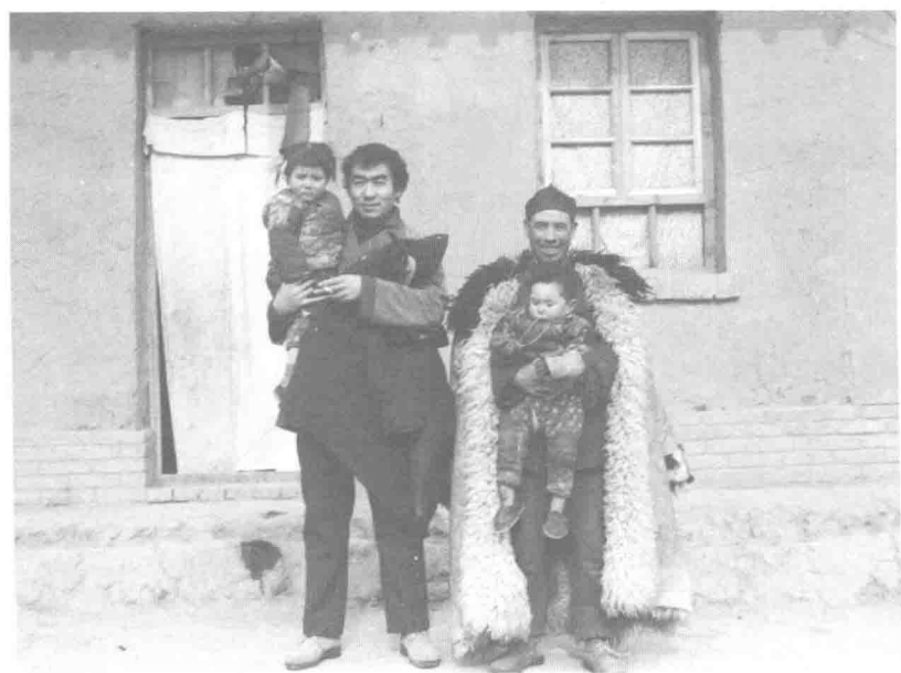
1984年 - 初入西海固