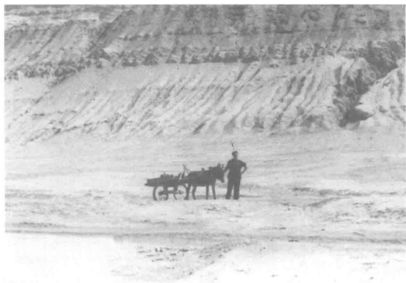
1982年 - 走遍吐鲁番