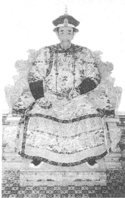
清康熙皇帝爱新觉罗·玄烨像

房屋尽在水中，于是登岸观察水势，招来当地老人，细问原因。再由扬州到京口，乘沙船西下，抵苏州而回。在南京，康熙帝亲自祭奠了明太祖陵墓，又赴高家堰检查堤岸工程，最后经泗水回曲阜，拜谒孔林后，由德州返回。康熙二十八年（1689年）正月，康熙帝开始第二次南巡，于二月到达杭州，渡过钱塘江拜谒禹陵，三月由南京起程回北京。康熙三十八年（1699年）二月，康熙与皇太后一同举行第三次南巡，他“亲乘小舟，不避水险，各处周览，”还登上