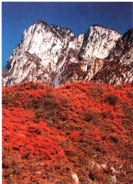
▲2004年2月13日嵩山被联合国教科文组织评选为“世界地质公园”

古时候，人们都相信神仙。神仙住在哪儿？总不会全都住在啥也没有的白云堆里吧。人们就想，神仙在天上住久了，也得到下界来住几天才行。