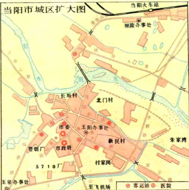
当阳市城区扩大图