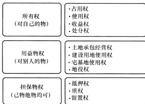
图 1-4 物权的种类