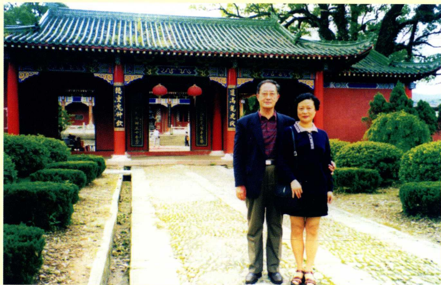
两位作者初访江西龙虎山张天师府（1999年5月）