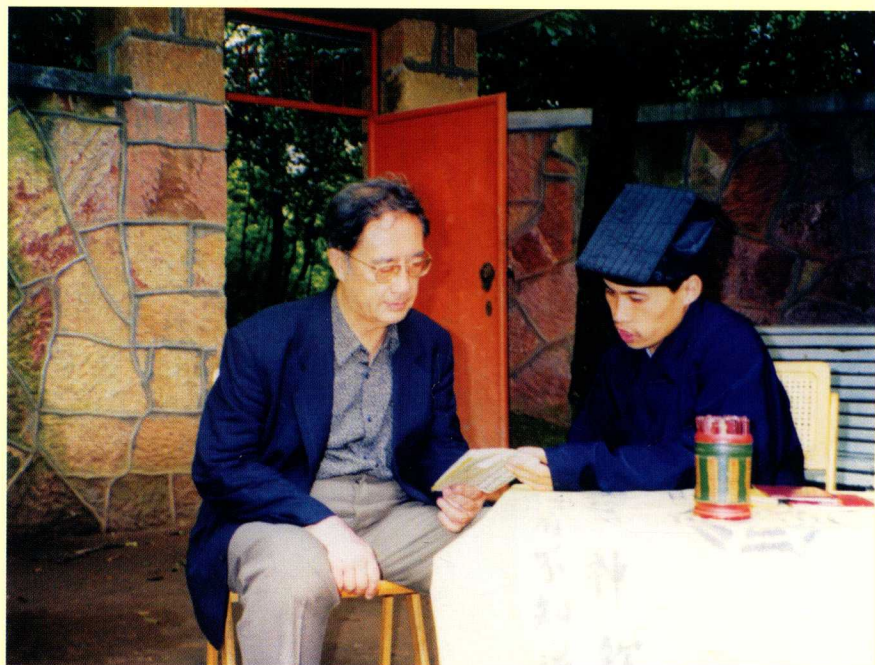
作者刘达临和龙虎山的道士探讨性文化（1999年5月）