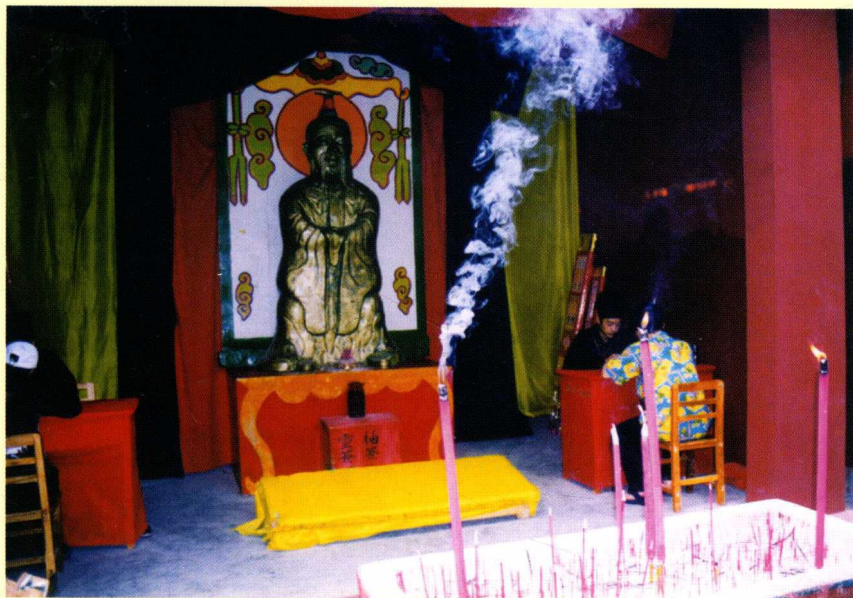
道观大殿（云南昆明）