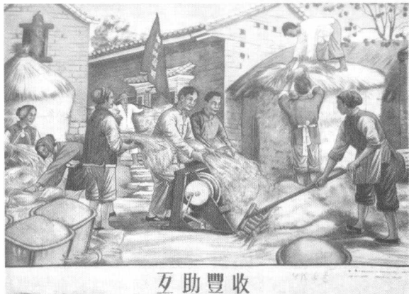
新中国成立初期的宣传画《互助丰收》

东台农民的互助传统并非孤案。笔者近年的研究表明，自然环境恶劣、贫穷落后的乡村较之相对富庶的鱼米之乡，会有更加悠久的互助传统和更大的生产互助的动力。在贫瘠的大别山区，贫苦农民只能依靠自发的互助组织才能完成春耕、收割等农活或度过荒年。早在抗日战争前，长治等老区就有共同开荒和互助劳作的习