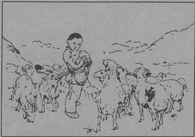
1 海娃今年十二岁；海娃放了四年羊。