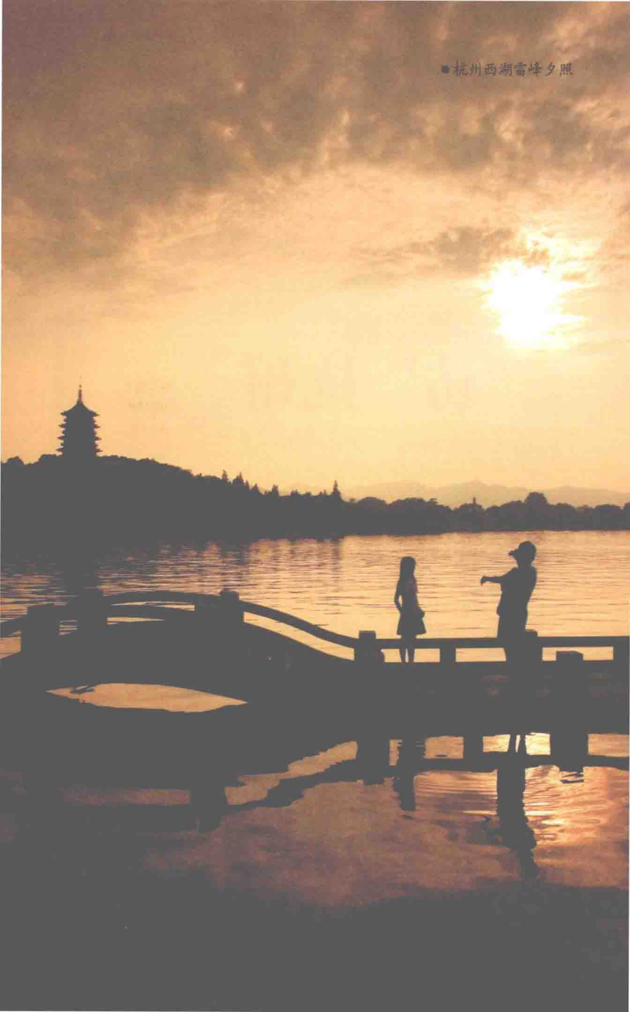
● 杭州西湖雷峰夕照