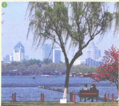
② 杭州西湖 West Lake Cultural Landscape Of Hangzhou

了自己最妥善的记录；而苏东坡、胡雪岩、龚自珍、章太炎、潘天寿、林风眠、盖叫天、郁达夫等等列举不完的名字，则揭示了这座城市的文化渊源。