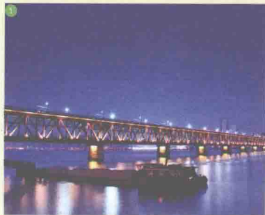
① 钱塘江大桥夜景 Qiantang River Bridge Night