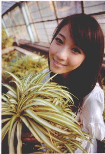
让模特捧起一盆兰花，这是与现场元素的一个互动，突出了花窖的场景特色。同时，手里有道具，也会让模特的表情更加自然

由于左侧大面积窗帘的存在，视觉上有对模特倾斜身姿的扶持、支撑效果，所以并不感觉失衡