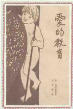
*《爱的教育》中文译本，华东师范大学出版社1995年12月出版，夏丏尊译。

全书从10月份意大利小学生开学的第一天开始写起，一直写到第二年7月份考试后学期结束。书中的小学生安利柯以童年的眼光与心灵观察和感受身边的人和事，然后用日记的形式一篇一篇地写下来。除了这些感人的小故事，书中也记下了安利柯的父母在他日记本上所写的劝诫和启发性的话语，和一些情意深切的留言。此外，日记