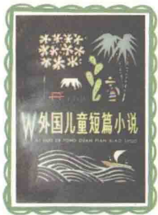
•《外国儿童短篇小说》中文译本，少年儿童出版社1979年出版，《少年文艺》编辑部编。

可是现在的小说，已经发生了很大的改变。现在的小说家们很少像过去的作家那样，单纯地去讲述故事，去描述自己的所见所闻了。小说到了今天，包括少年小说和儿童小说，似乎已经演变成了作家在文字里操练“精神冒险”的工具，不