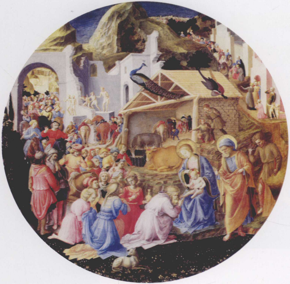
图7 东方三博士来拜 安其里柯