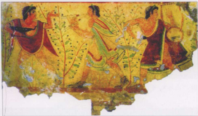
图1 狂欢者 塔尔圭尼亚

欧洲绘画实践史上出现了使用三种不同性质的媒介剂来调配渲染颜色,它们分别是水性的、半水半油性的和油性的。以水性溶剂为媒介形成了水彩、水粉画(早期为胶粉画);以半水半油性的溶剂为媒介形成了坦培拉绘画(现在的丙烯画也是这种性质);以油性溶剂为媒介形成了油画。我们现在所说的油画应该包含那些半水半油为媒介的坦培拉绘画。因为它们形成过程中存在着千丝万缕的联系,我们认真留心这一过程会帮助理解油画语言的性能特点。