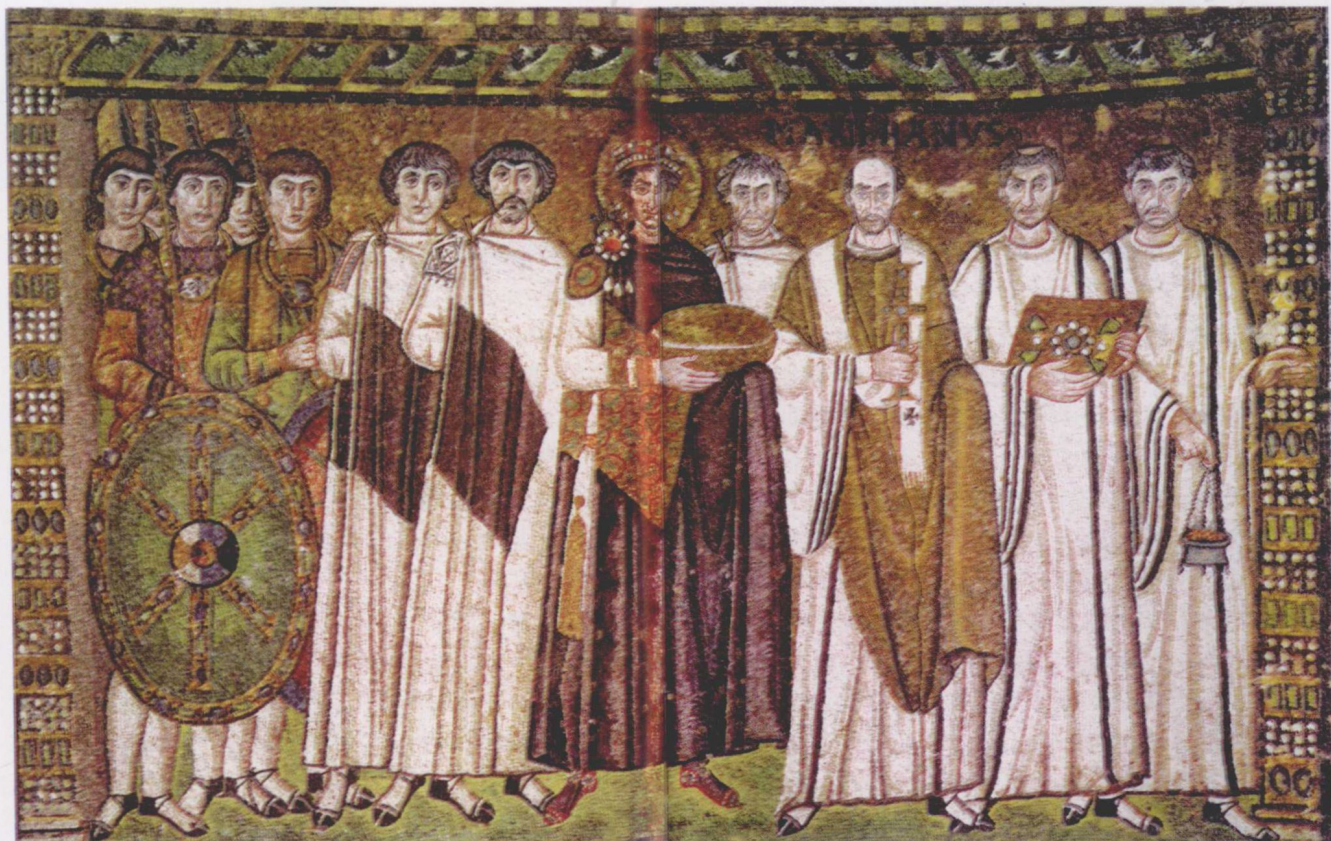
图3 查士丁尼及其随从 拉韦纳

这一油性媒介剂的采用在绘画史上带来两大奇迹:其一,它宣告油画正式创立,使油画家得以采用这种媒介剂后能够自由运笔,不受时间所限,放心对画面细节和细微之处精雕细刻,使光色层次得到细致入微的表现,满足了15世纪画家对表现细致的观察感觉的需要。由于这种技巧能够很好地传达视觉感觉,后来导致了直接画法的产生。其二,它导致了半水半油性的坦培拉绘画技术材料的改革。此前的蛋彩画是以蛋黄加水而制成媒介溶剂,称为蛋黄乳液。这种乳液含有水、胶、油的成分,这些成分起到黏合、润化、稀释的作用。正是根据这些特点,画家们发展了新的材料替代品,如其中胶的成分被树脂代替,如达玛树脂、玛蒂树脂都是最理想