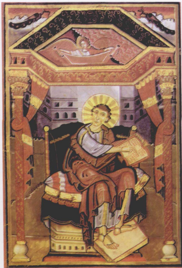
图2 圣马大 手抄本插图

从14世纪起,在威尼斯,由于航海船运的需要,帆布业发达,画家们便开始尝试以帆布为依托作画,取得成功。这使已往媒介材料的缺陷也日益尖锐地摆在画家面前。需要一种不易干的,便于改动的绘画材料才能满足画家对细微的层次和复杂的形体表现需要。这种困惑一直到15世纪尼德兰画家凡·爱克兄弟的笔下才解除。他一改以胶水和蛋黄为媒介剂,采用了一种油剂。这种油剂是透明不变色的,而且干得比较慢,一旦干后便凝固结实,这就是亚麻仁油,画家还发现核桃油也有相同性质。这种油和树脂及松节油结合,可以制出一种膏状的理想媒介剂。