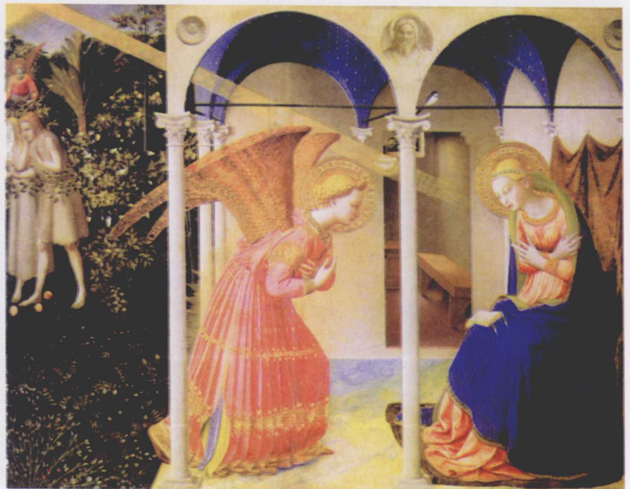
图6 报喜图 安其里柯