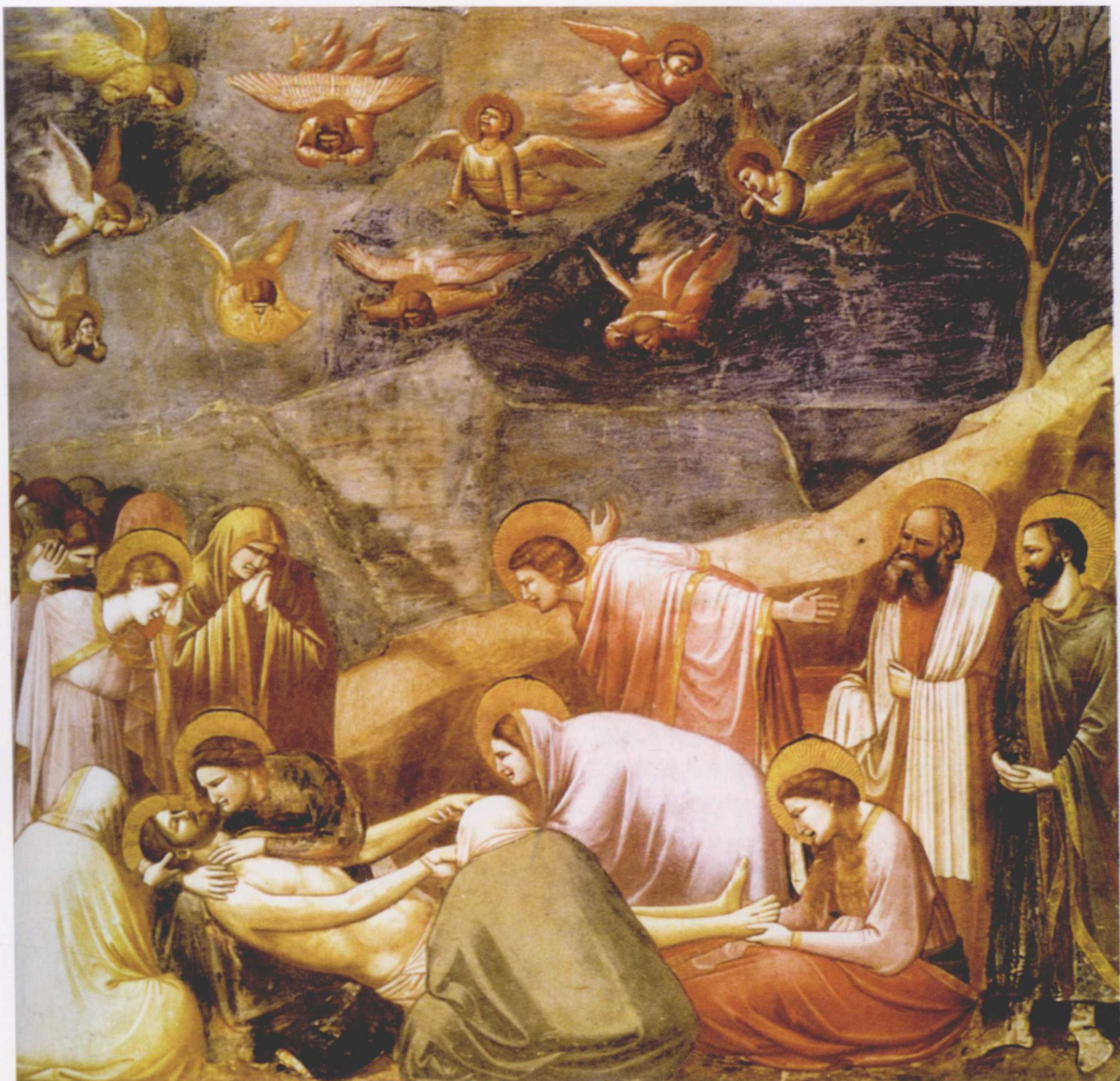
图5 哀悼的基督 乔托

景没有了，画中的人物真实地站在地上，枯燥和呆板不见了，立体感被完美地表现出来。乔托真正给绘画注入了活力，赋予了绘画艺术的创造精神。