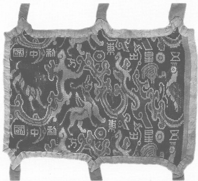
1-1 “五星出東方利中國”彩錦護膊

漢魏 縱 11.2 厘米、橫 16.5 厘米 1995 年新疆民豐縣尼雅遺址出土