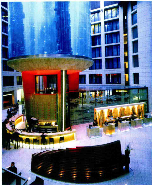
图1-1 某宾馆的中庭空间

公共空间中的“公共”二字，在我们的日常汉语中，应该包含两重意思，一是“公众的、公共的”，也就是“大家的”、“共有的”；二是“公开的”，也就是“当众的”、“发表的”。“公共”在一定意义上包含了一种平等、参与、互动、共享、共有、共同等内涵（图1-1、1-2）。