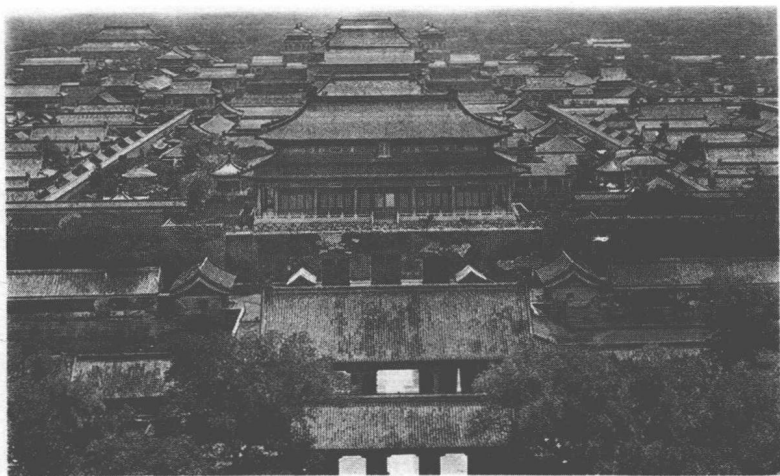
晚清时的北京城，见证了一个王朝的衰败

借助天公的雷霆之气，冲破这层笼罩着中国的鸦片烟雾，让人存有些许安慰和希望。近代中国的序幕，从林则徐这个福建教师的儿子走出京城后，就正式拉开了。