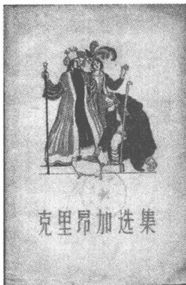
《克里昂伽童话》1958年中国首版封面

享誉世界的名作：《童年回忆录》、《真假太子》、《克里昂伽童话》、《老山羊和三只小山羊》、《猪王子》、《伊凡和背包》、《小钱袋》、《五个面包》等。