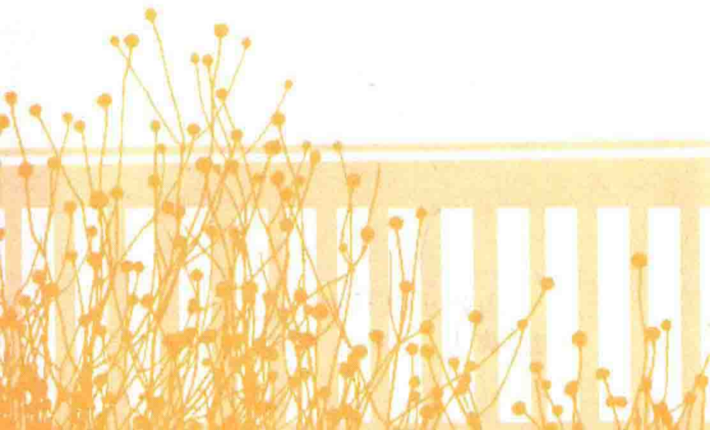
插图 苏毅强 许聪