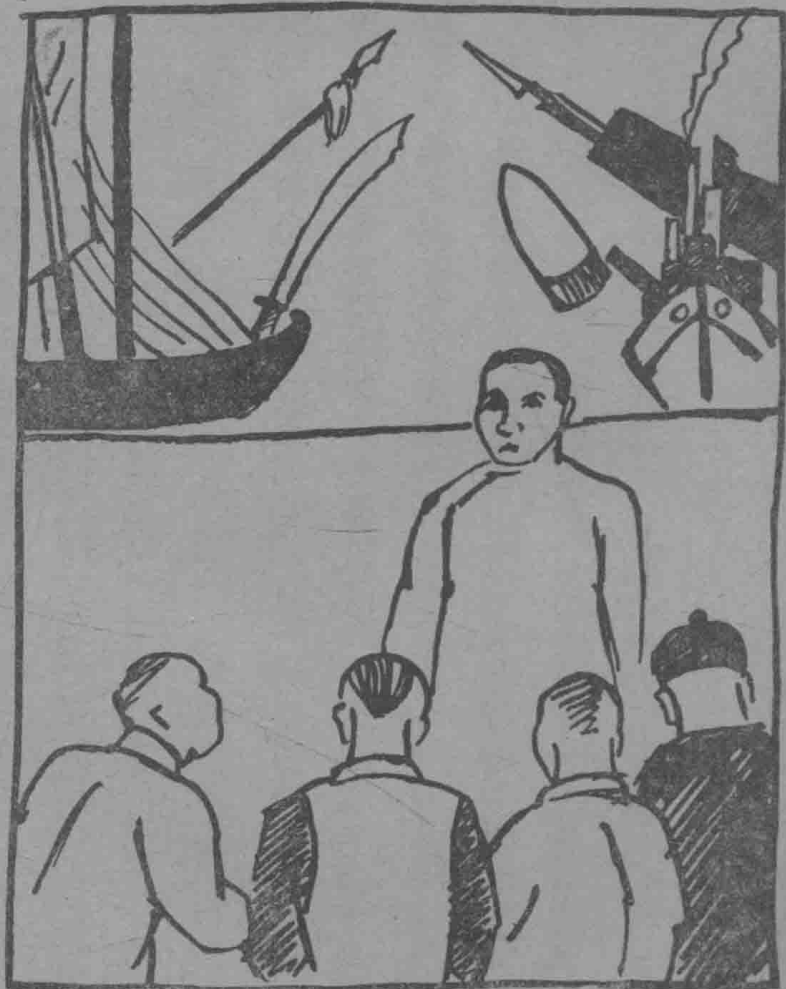
○傳宣衆民向生先 山中 ，後爭戰 法中