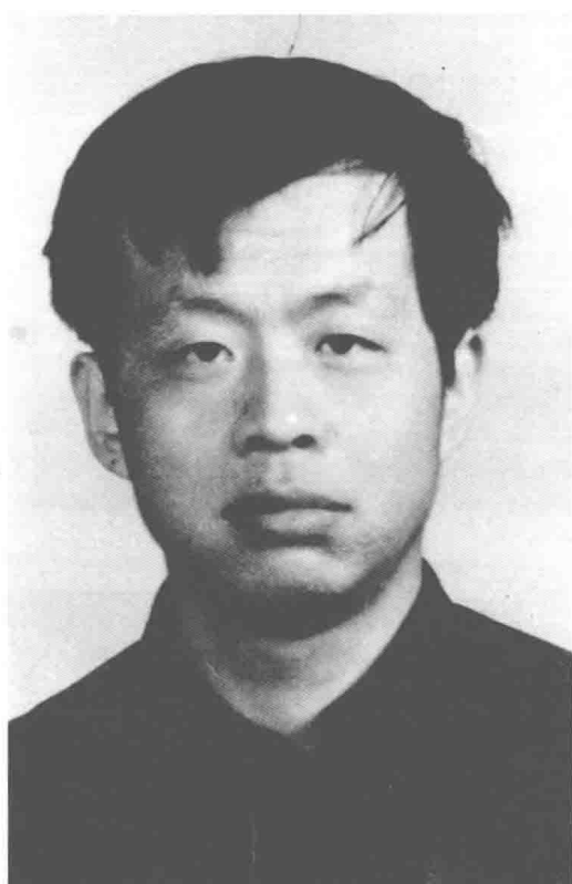
1978年中国人民大学学生证证件照