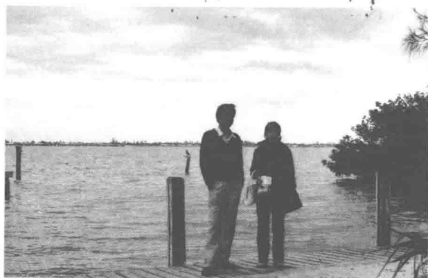
1985年赴美国南部旅游途中