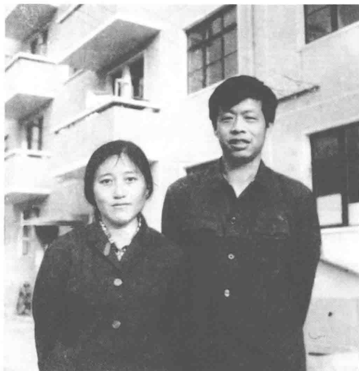
1980年初婚时于人民日报宿舍楼前