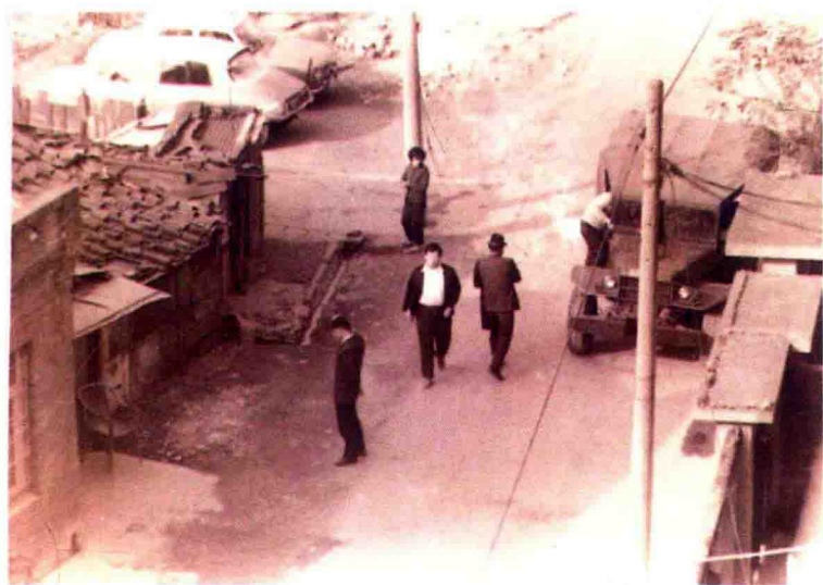
被警总软禁时，军车公然开来换班。