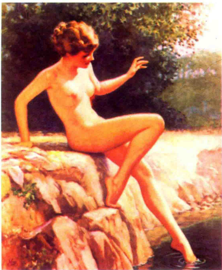
华特·奥图 (Walt Otto) 的“夏日即景” (Summer Idyl), 画一裸体少女, 伸出一足, 溪边试水, 我被这画迷住了。