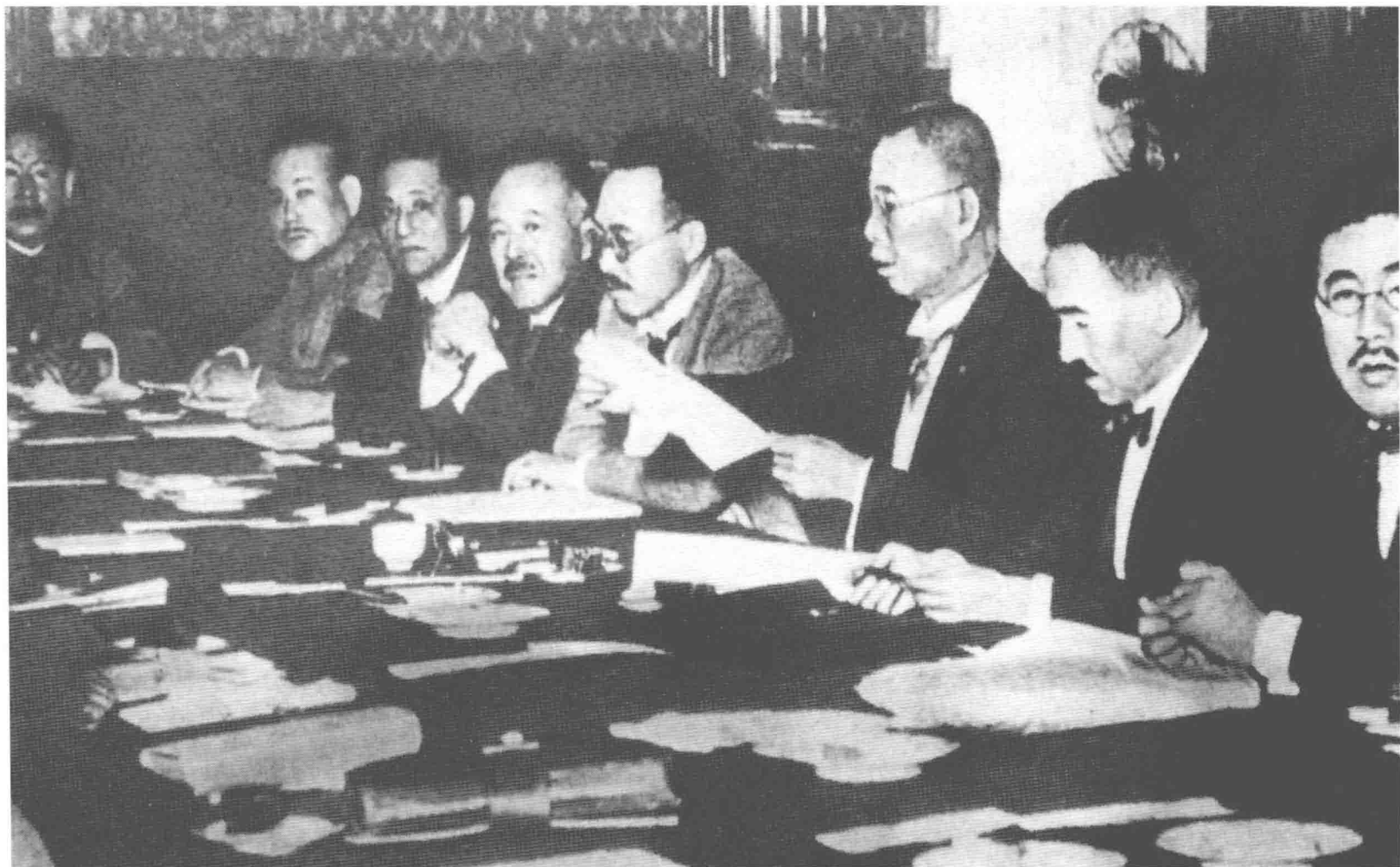
田中內閣「東方會議」。1927年4月，日本陸軍大將田中義一組閣，同年6月27日至7月7日，田中內閣為制定侵略中國的總方針而在東京召開了「東方會議」，中心議題即是所謂的「滿蒙政策」。