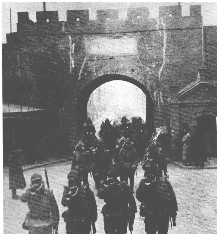
日軍在九一八事變後進入瀋陽。