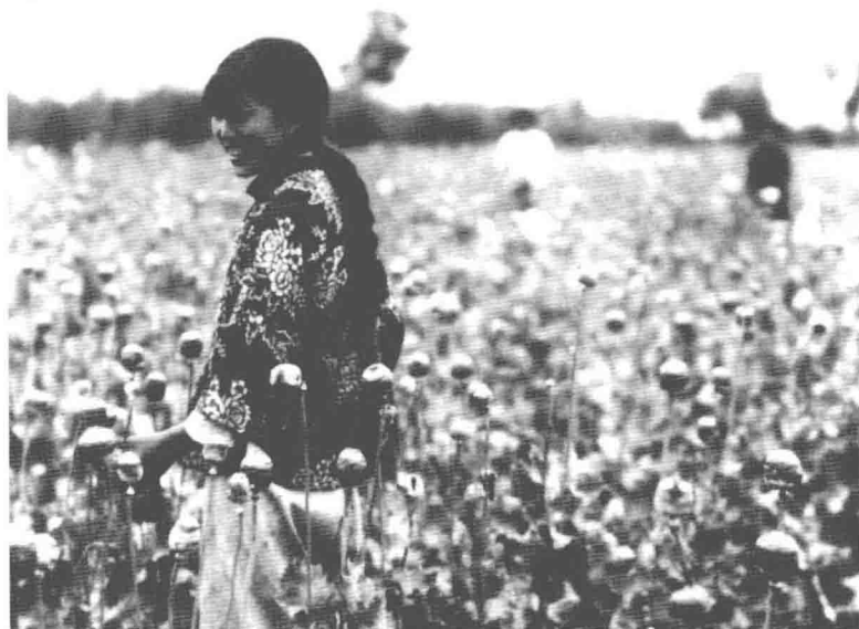
滿洲地區物產豐富，有廣闊的可耕地，豐富的林業、漁業資源，煤礦、鐵礦等多種原材料儲量豐富。「滿洲國」是當時世界上經濟發展最快的「國家」之一。圖為北滿地區採收棉花。