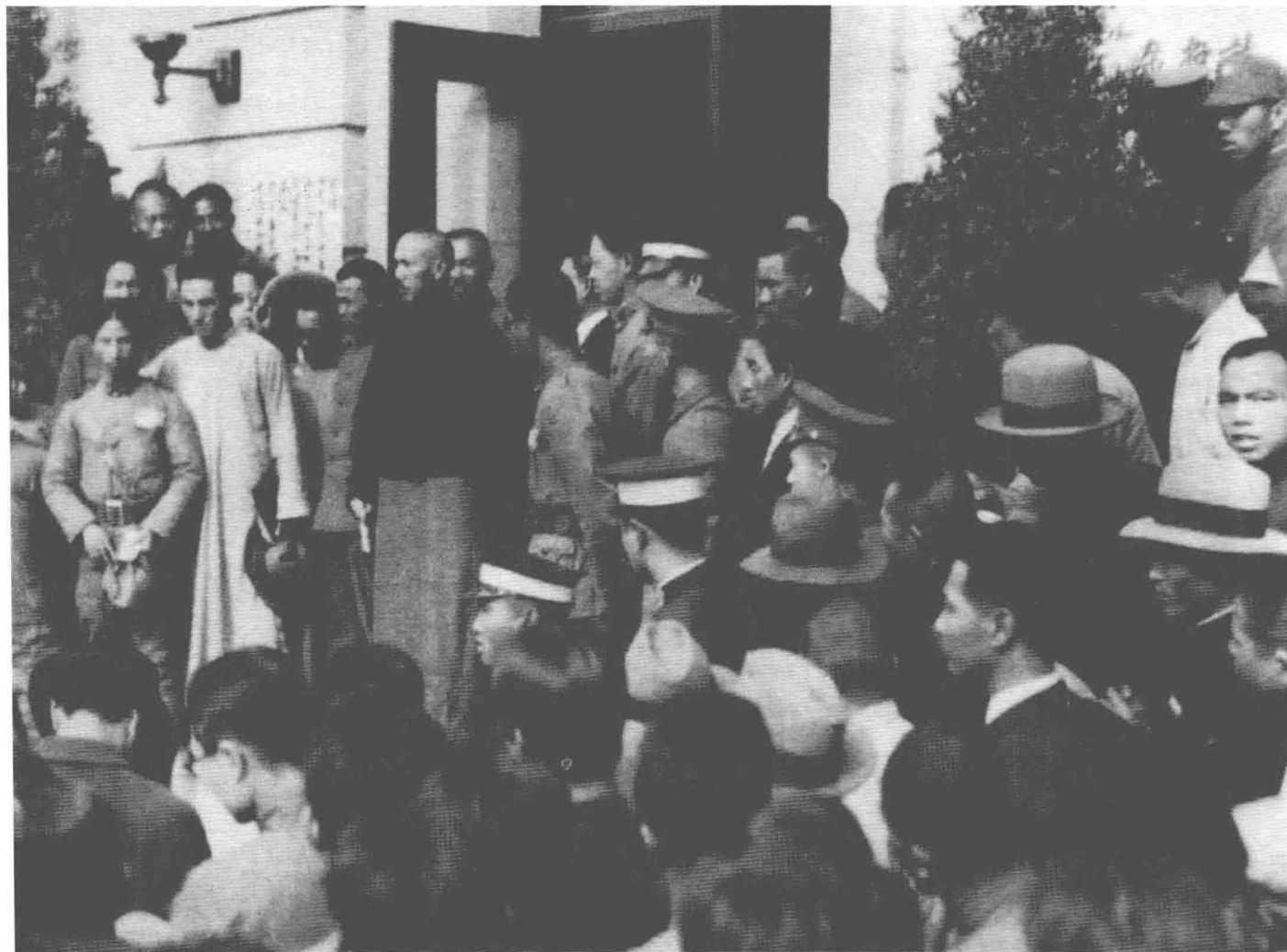
1931年12月5日，中華民國的最高領袖蔣介石走出南京國民政府的大門，親自與砸毀《中央日報》與國民黨中央宣傳部並包圍了國民政府的請願團（中共學生運動代表）平等對話的歷史鏡頭。