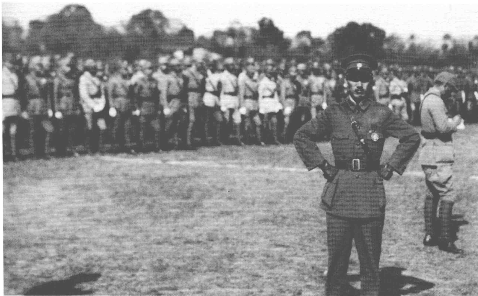
蔣介石在檢閱討伐閩變的軍隊。福建事變簡稱閩變，發生於1933年(民國22年)11月，為在福建發動的反對蔣介石政府起事，其後成立了「中華共和國人民革命政府」。由於未得到各方支持，次年1月即被蔣介石以優勢兵力擊敗。