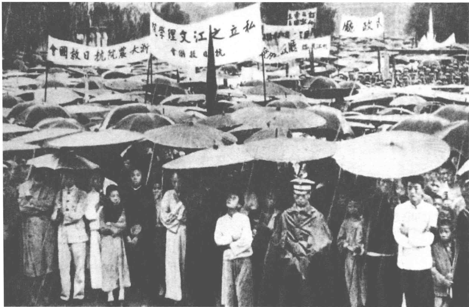
九一八事變激起中國的反日浪潮，這是杭州市舉行的抗日救國大會的現場情景，當日有10萬人在雨中佇立數小時。