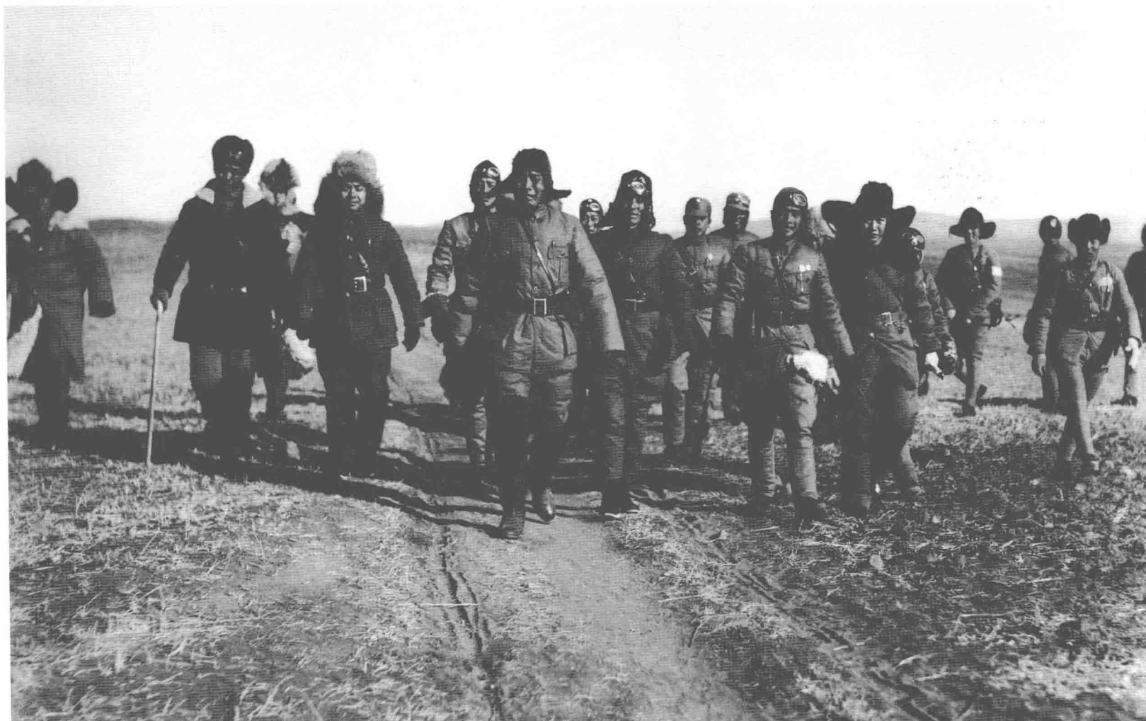
湯恩伯視察綏遠前線部隊。「綏遠抗戰」發生於1936年11月－1936年12月。1936年，基於中國軍隊反對日本主張的蒙古自治與滿洲國主權，11月開始，王英「大漢義軍」和蒙古地方自治政府秘書長德王、李守信開始與以傅作義為首的中華民國軍隊交戰。之後傅作義奪回百靈廟、錫拉木楞廟等戰略要地多處，獲得戰爭勝利。