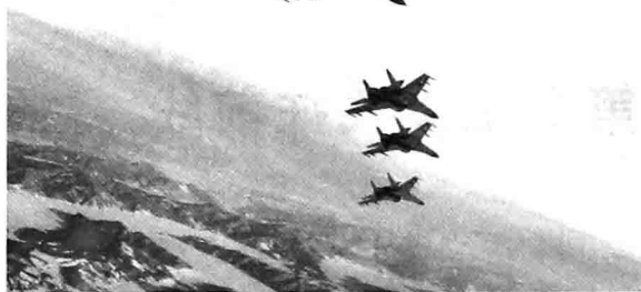
美英战机进行空中打击

由于投入了信息化武器装备系统，美英军完全掌握了战场制信息权，能够对塔利班武装和“基地”组织实施远近互补式的精确打击。交战中，美英军使用的精确