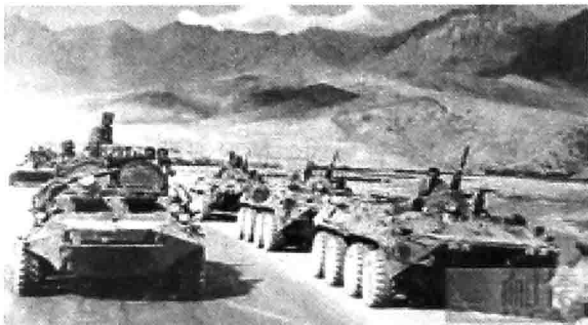
1979年12月，苏联入侵阿富汗

1979年12月，经过精心策划和周密准备，苏联趁美国与伊朗关系恶化和南亚动乱之际，采取突然袭击的方式，对阿富汗发动了全面入侵。它动用9个多师10多万人，以陆空协同的突击行动，7天之内席卷了阿富汗全境，并建立了由它直接控制的卡尔迈勒政权。