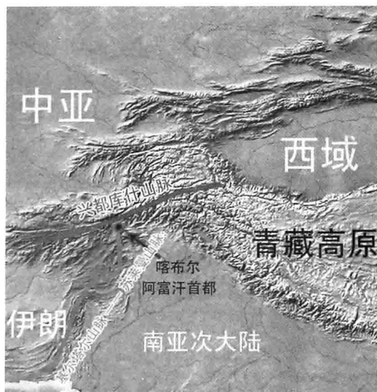
阿富汗战略位置示意图

高山纵横，不利于大兵团和机械化部队展开作战；高原河谷之间，关隘重重，易守难攻，更是阻挡外部势力入侵的天然屏障。