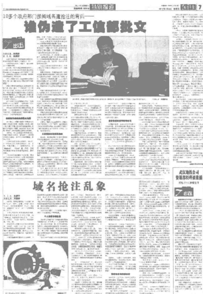
图 1-2 《中国青年报》“特别报道”版

发展、结局及其影响。连续报道的题材，通常是不可预知的事件性新闻，报道时间起于事件开始，止于事件结束，因其具有跌宕起伏的情节而容易吸引读者持续关注。