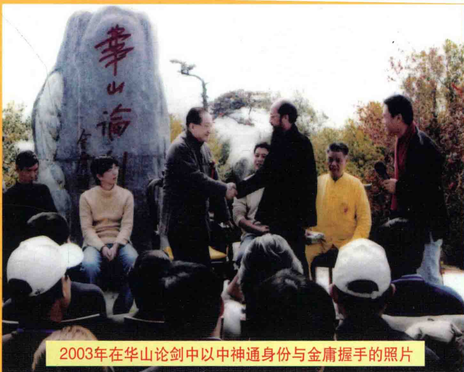
2003年在華山論劍中以中神通身份與金庸握手的照片