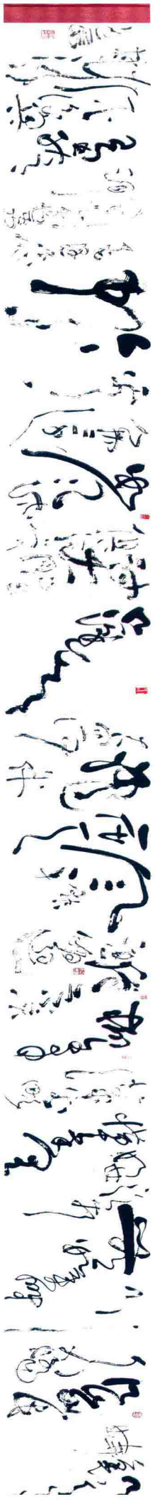
作品尺寸：900cm×50cm 作品类别：狂草