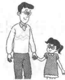
김 선생님, 딸