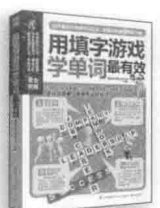
用填字游戏学单词 最有效 捷径文化语言企编小组 著 9787553730257