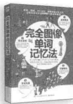
完全图像单词记忆法 易人外语教研组 著 978755372467