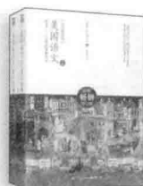
美国语文 (双语插图版) [美] 威廉·H·麦加菲 著 9787214127600