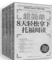
超简单 轻松拿下托福考试 [韩] 巴克达语言教育中心·著 9787553734675