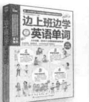
边上班边学英语单词 (畅销修订版) 我识全球语文教学中心 著 9787553736471