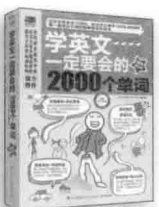
学英文一定要会的 2000 个单词 (畅销修订版) 我识全球语文教学中心 著 9787553737119