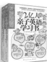
2亿人的亲子英语学习 书 (口语篇+情景篇) [韩] 想未来编辑部 著 9787553719030