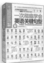
一次彻底学会 英语关键句型 张慈庭英语研发团队 著 9787553729657