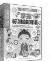
掌握标准韩国语1 (全2册) [韩] 祥明大学国际语言 文化教育学院教材开发部 著 9787553729626