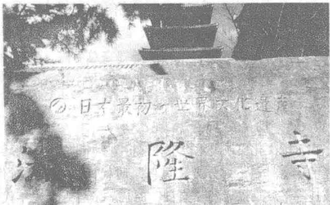
法隆寺的遗产纪念碑