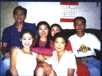
与获国家级奖的师大学生欢聚一堂