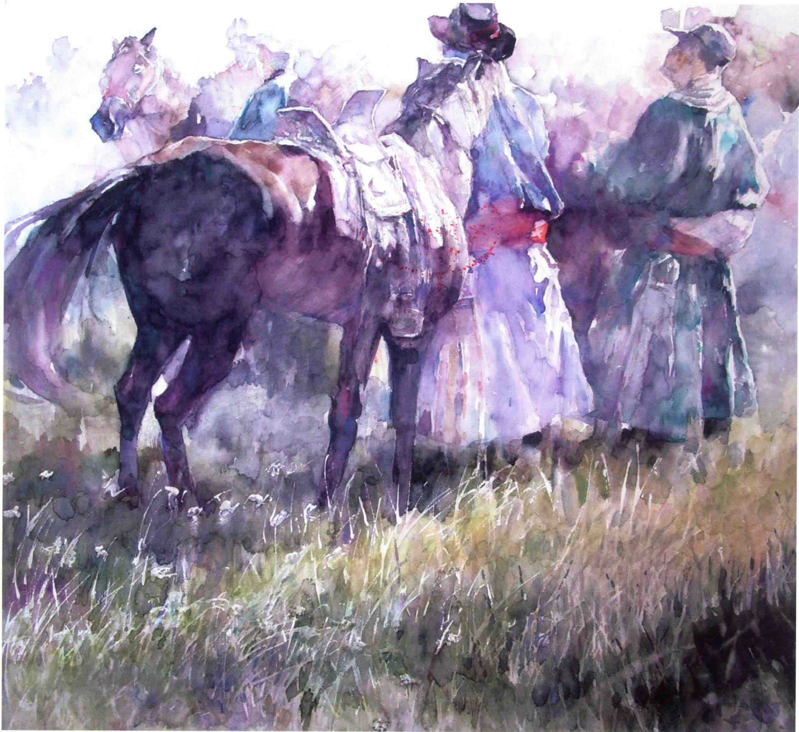
轻风 2008年 72cm x 65cm