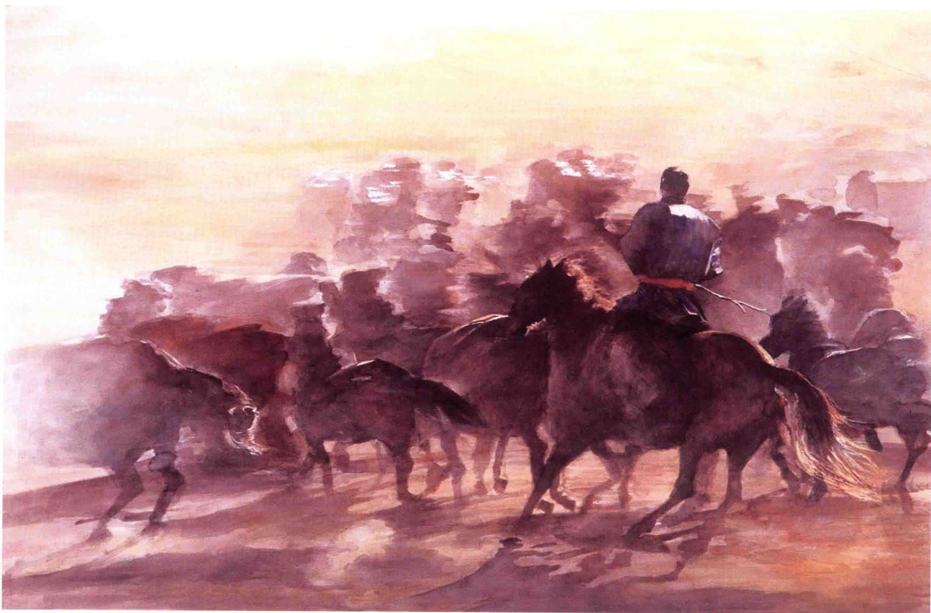
追风 2005年 70cm x 106cm