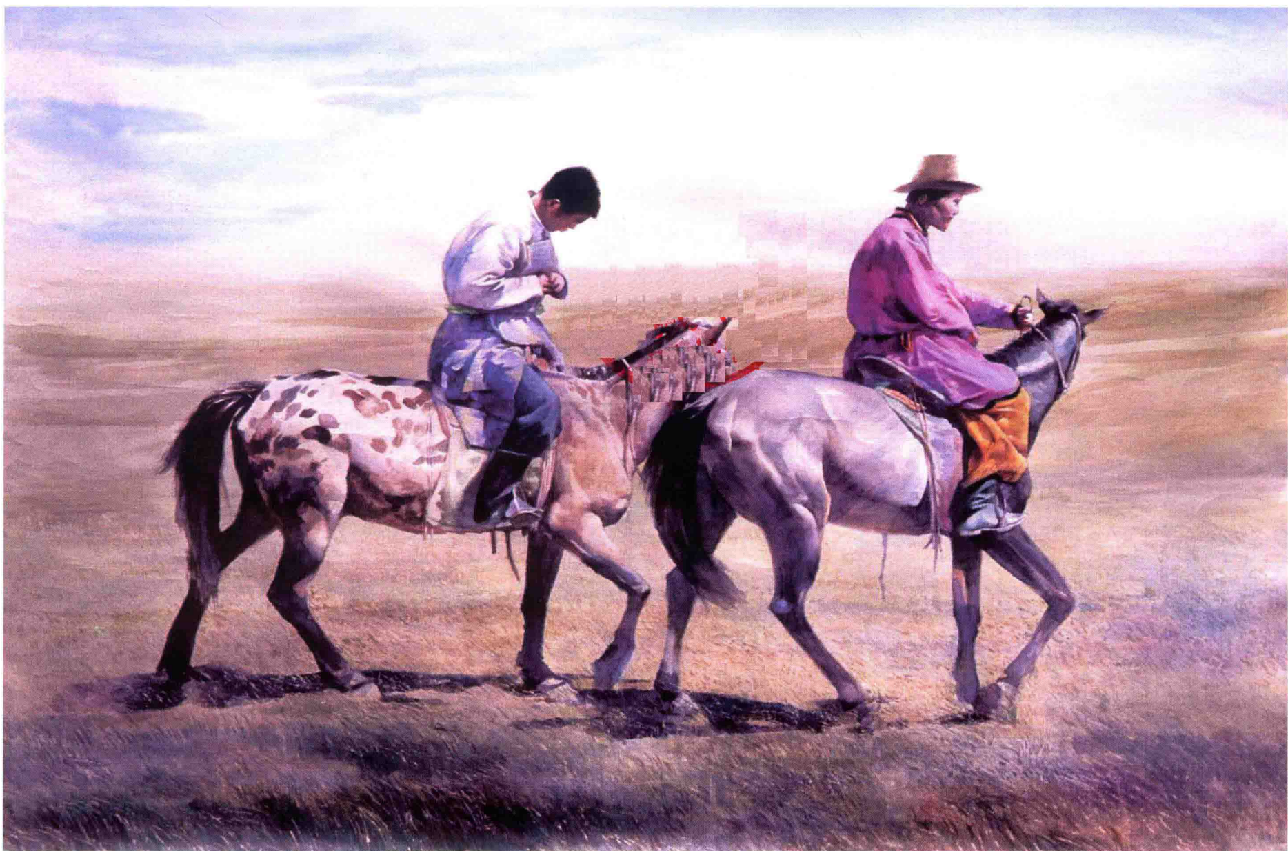
正午 2002年 103cm x 73cm