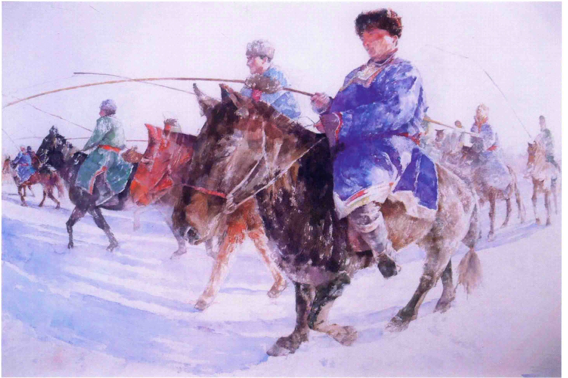
走马 2008年 107cm x 76.5cm