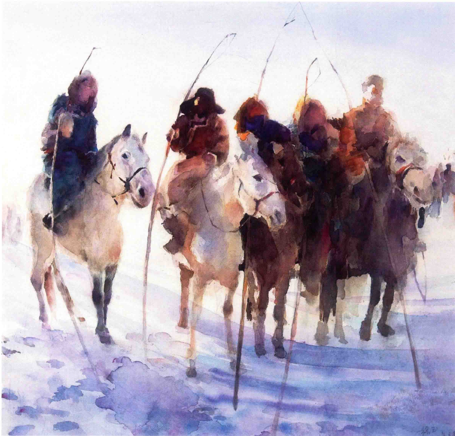
冬日 2008年 56.5cm x 58cm