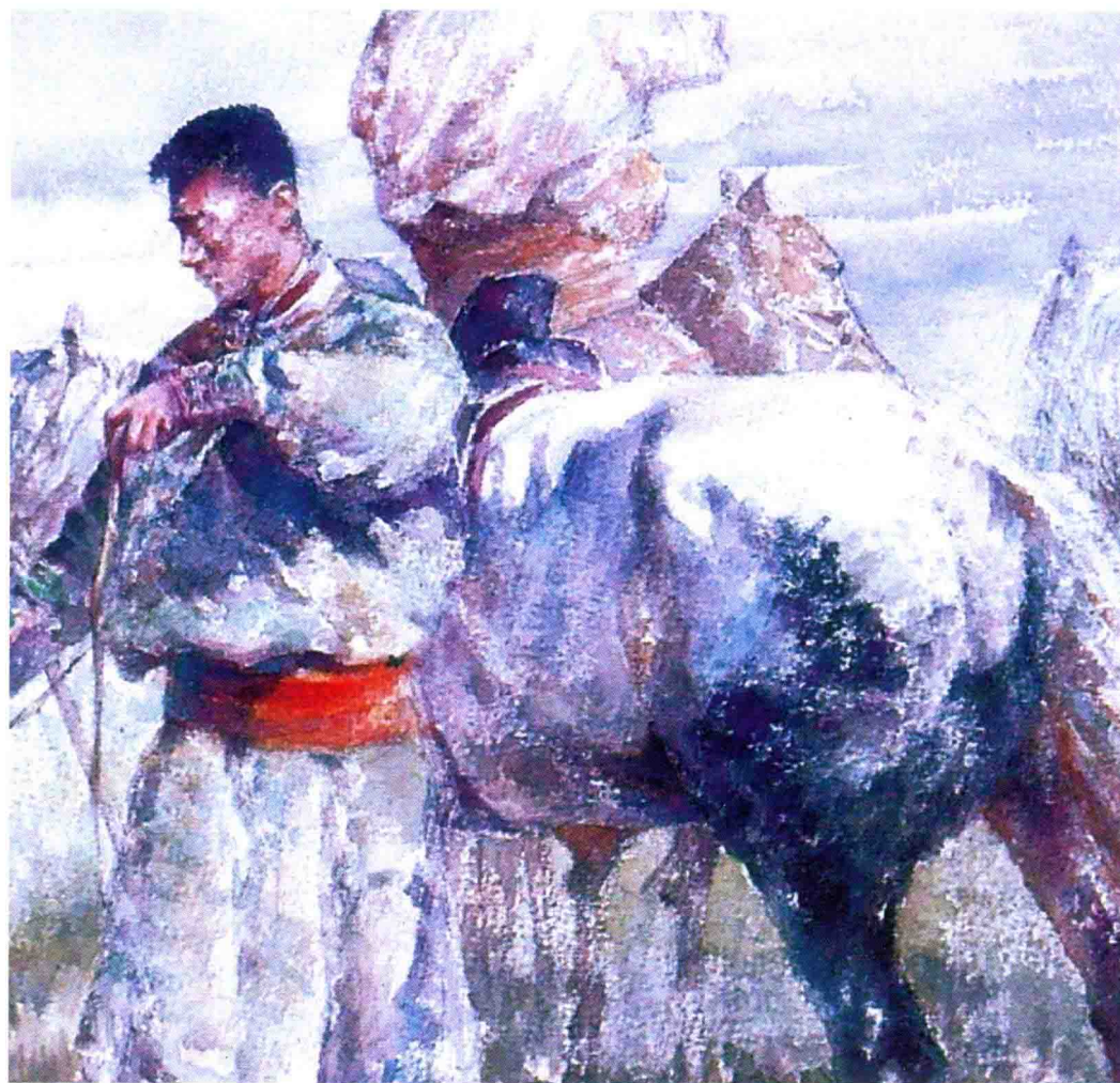
整装 2009年 76.5cm x 53cm