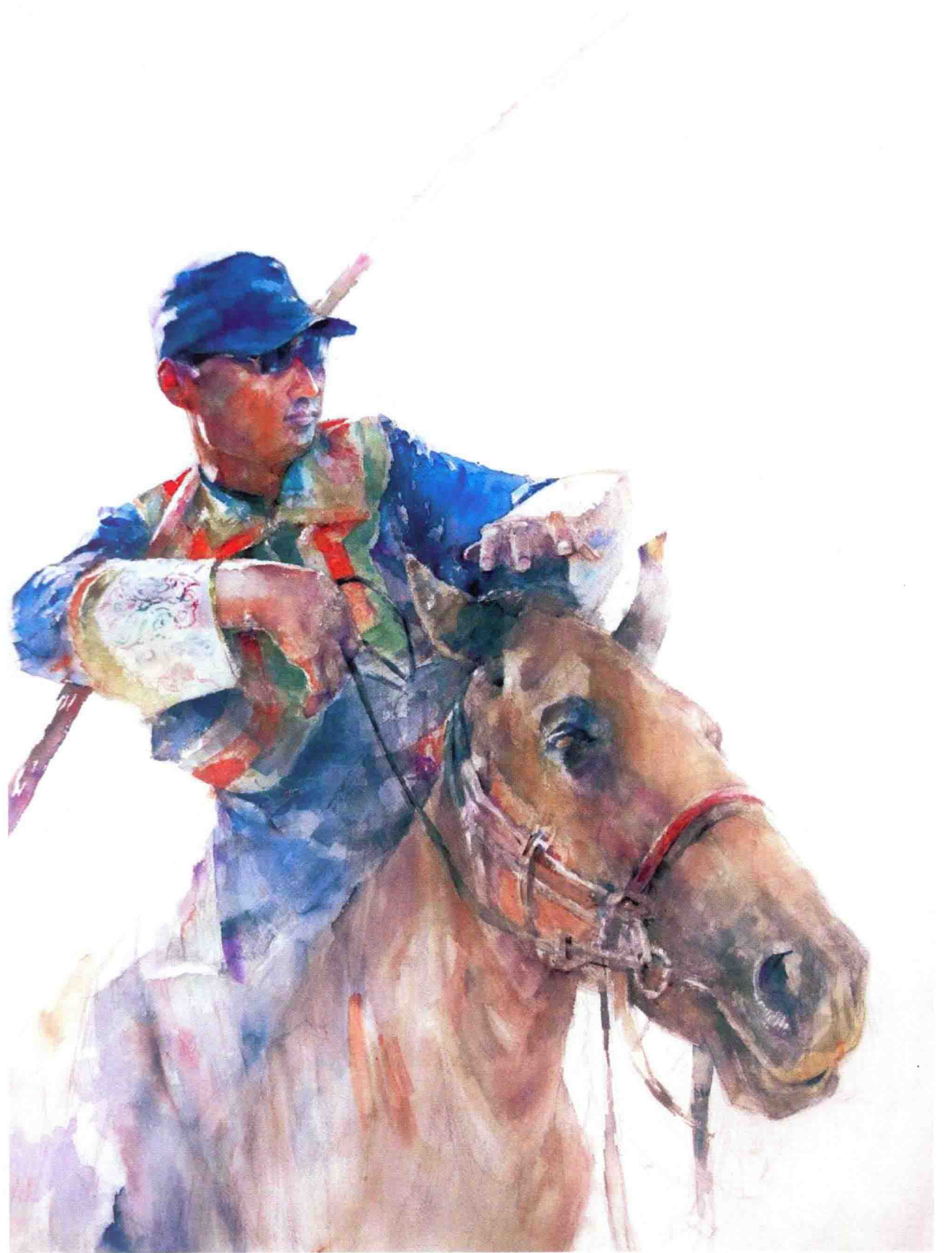
套马手 2008年 54cm x 74cm