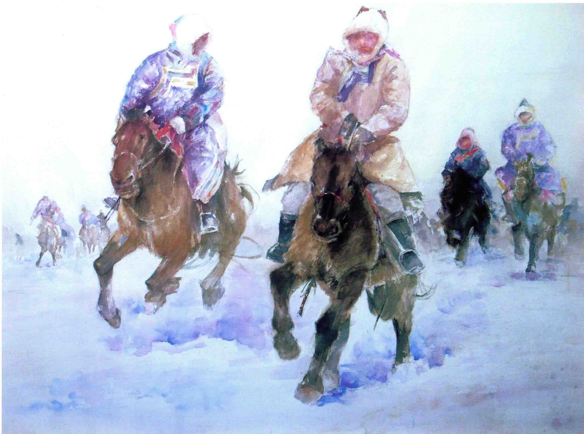
踏雪 2008年 110cm × 82cm