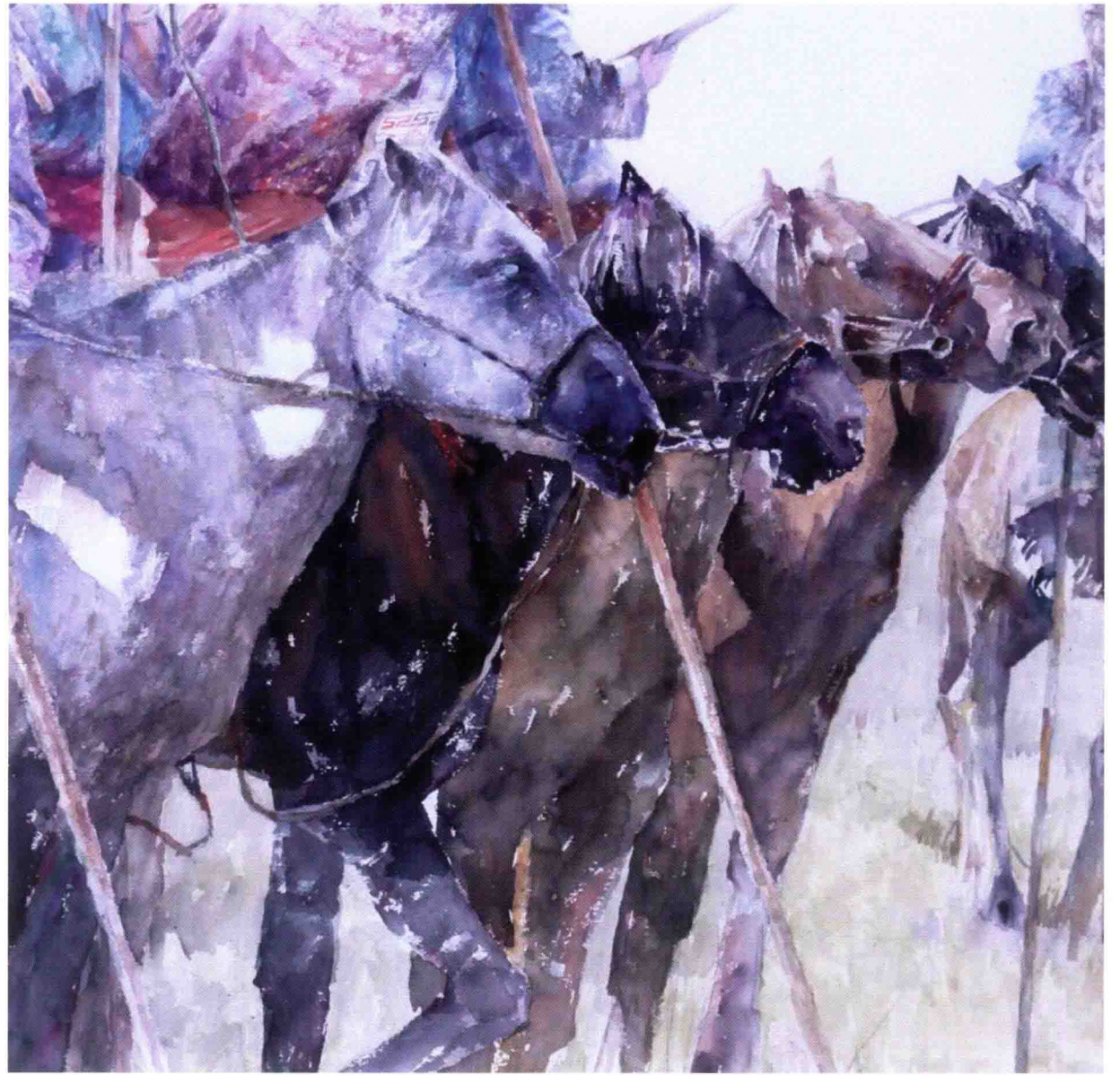
乌日格沁 2010年 149cm × 110cm