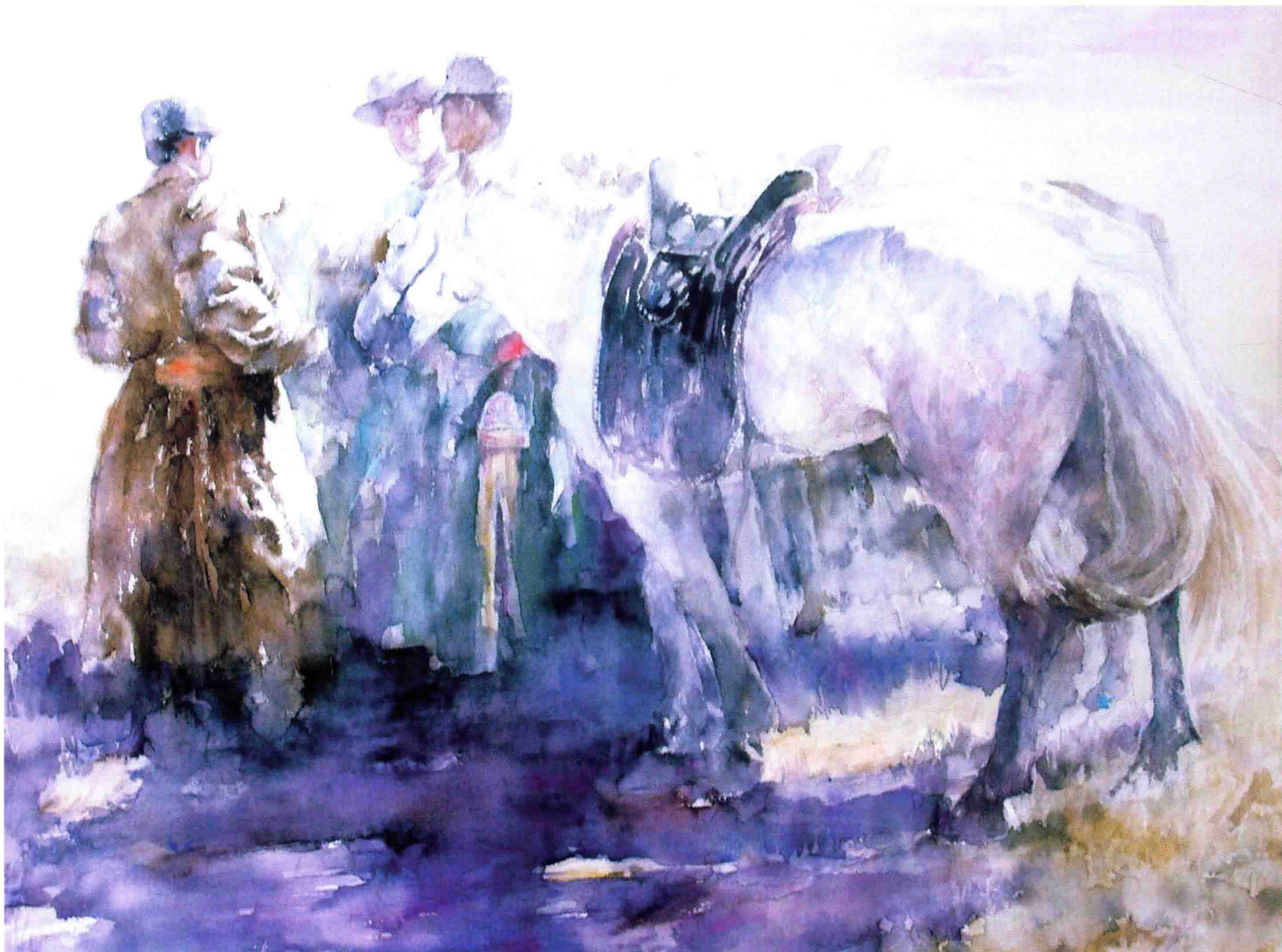
夏目 2010年 76cm × 56cm