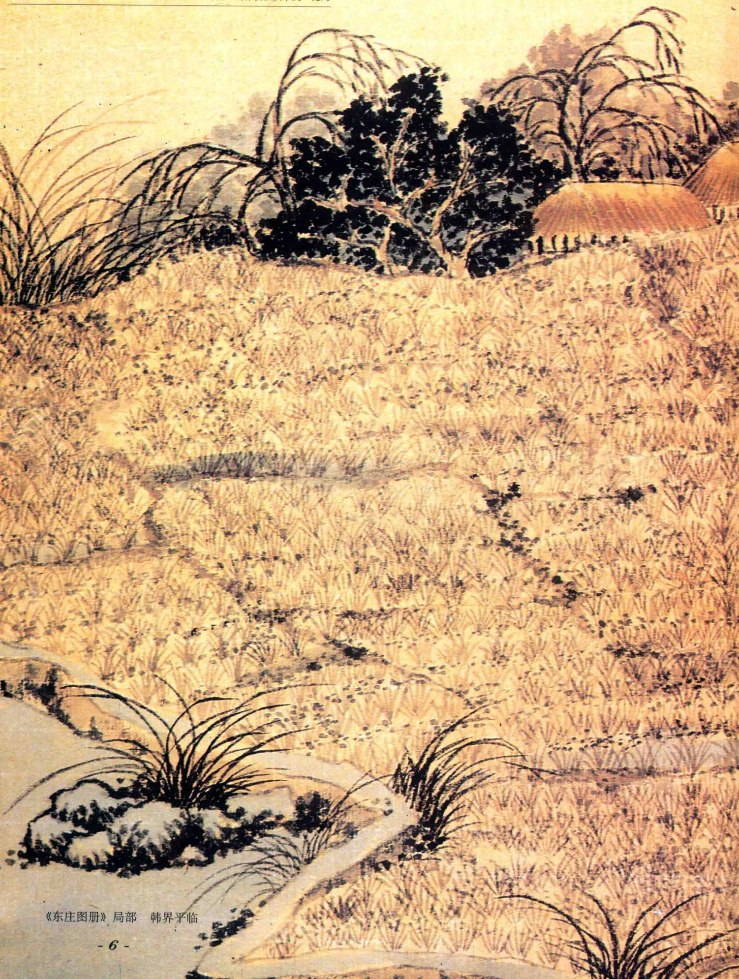
《东庄图册》局部 韩界平临