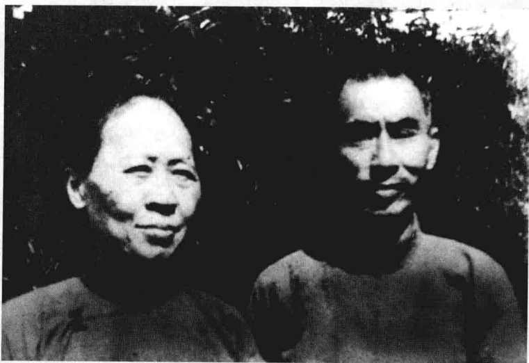
1943年初春，抗战期间，叶圣陶与夫人胡墨林拍摄于成都新西门外罗家碾住所外的小溪边。