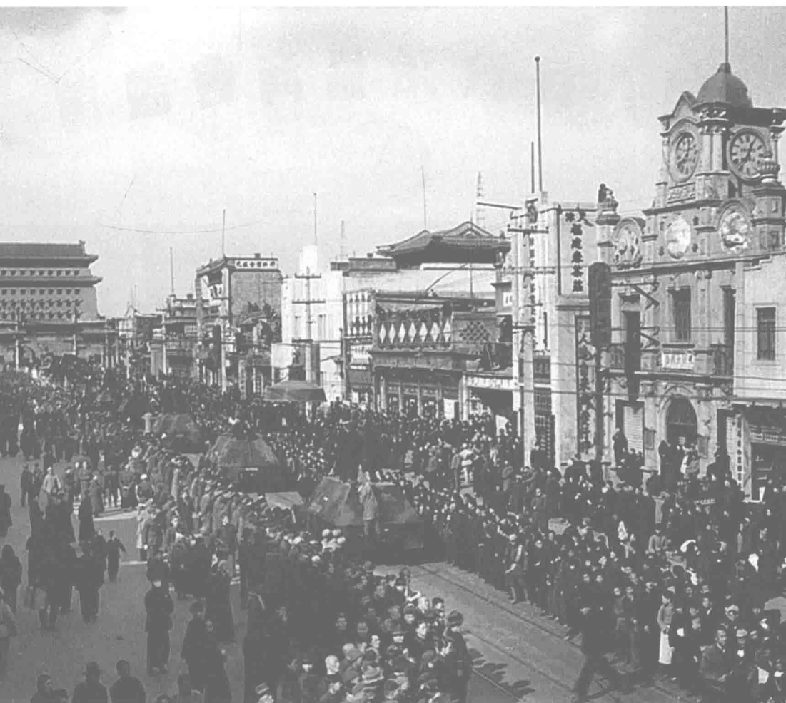
1949年2月3日，中國人民解放軍進入北平。