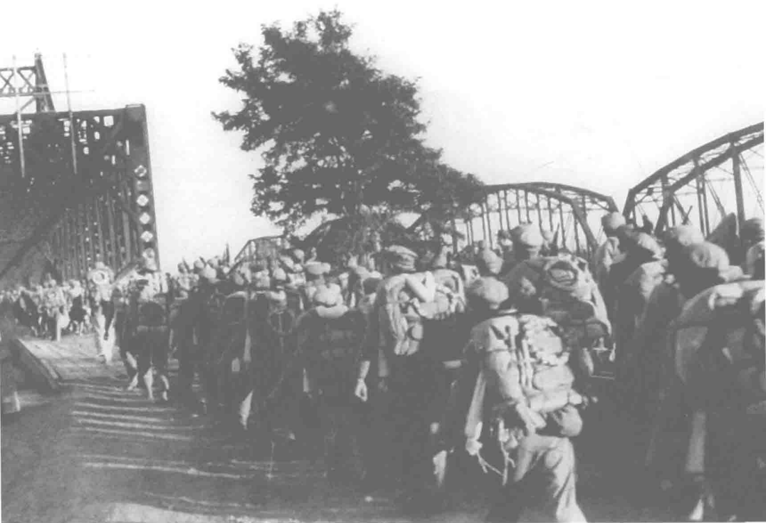
1950年10月25日，中國人民志願軍雄赳赳、氣昂昂跨過鴨綠江。