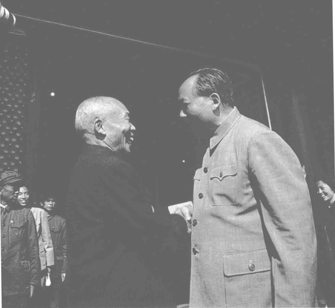
1966年10月1日，毛澤東與李宗仁在天安門城樓歷史性握手。