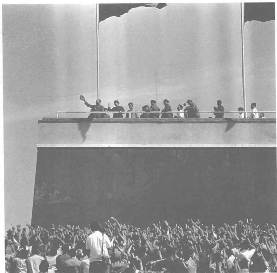
1966年8月18日，曾有狂瀾動海內。