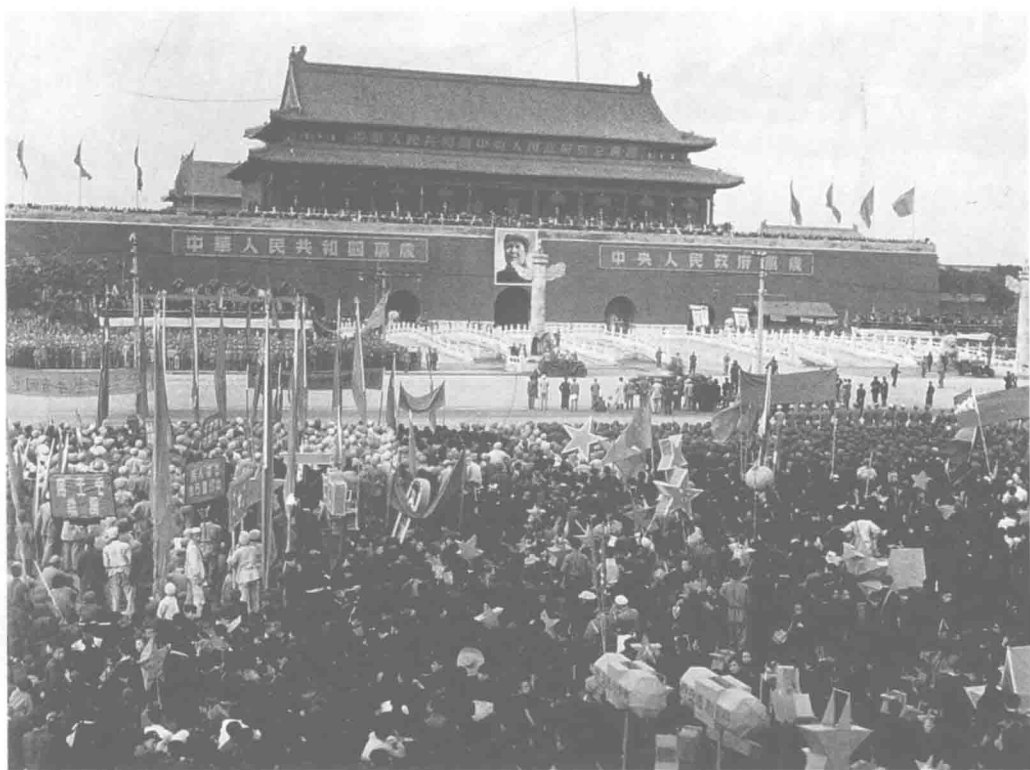
1949年10月1日·中華人民共和國開國大典。