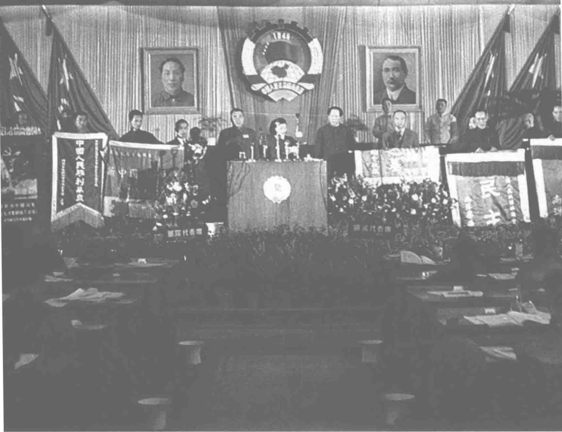
1949年9月，第一屆中國人民政治協商會議全體會議在中南海懷仁堂舉行。