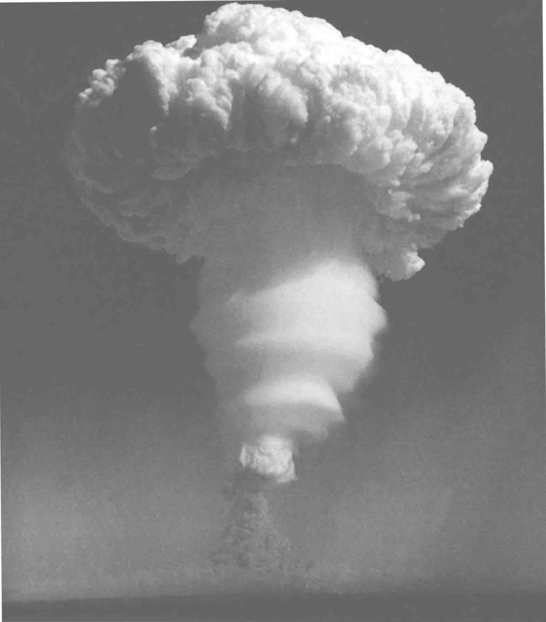
1967年6月17日，中國第一顆氫彈在新疆羅布泊爆炸試驗成功。