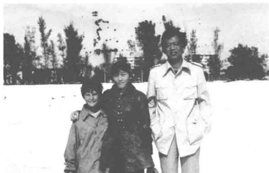
1985年赴美国南部旅游途中与美国小孩在一起