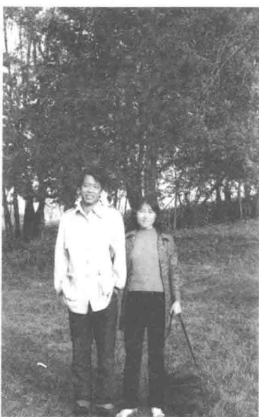
1985年赴美国南部旅游途中