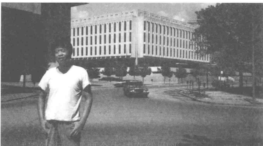
1980年代在匹兹堡大学图书馆前