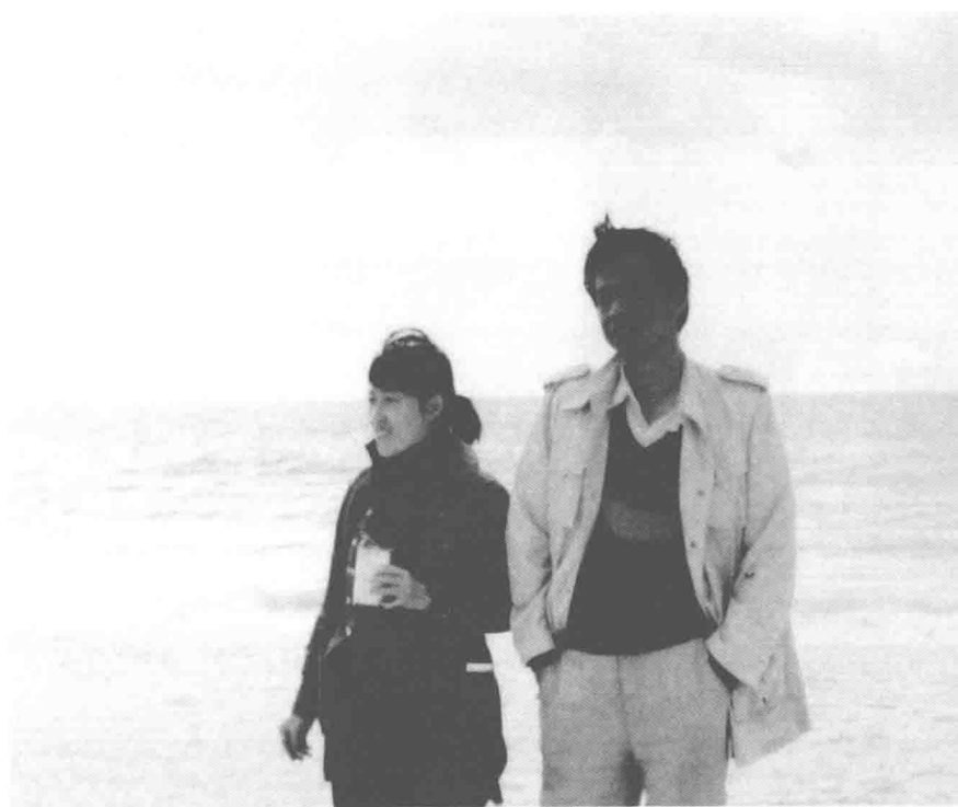
1985年赴美国南部旅游途