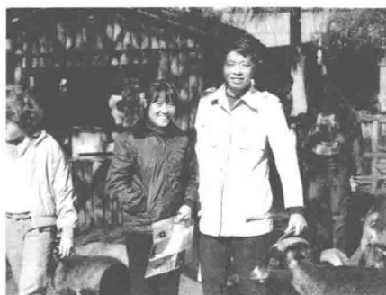
1985年在佛罗里达州迪斯尼世界