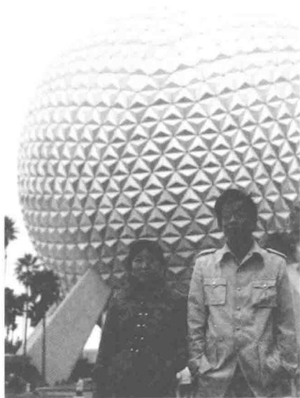
1985年赴美国南部旅游途中