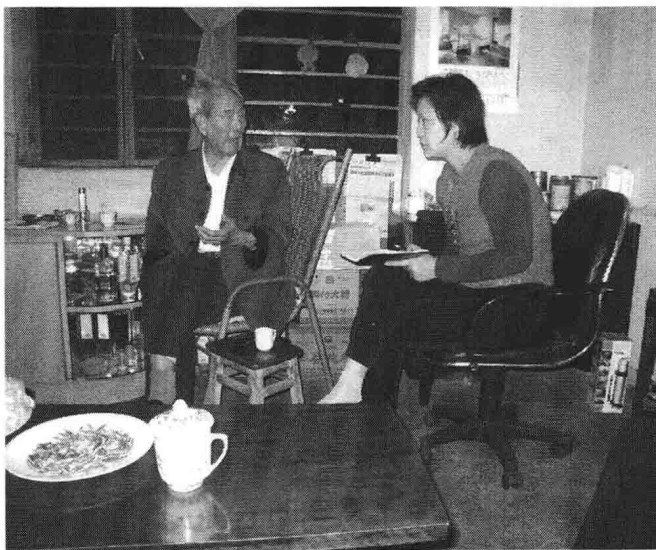
照片 14. 2007 年 5 月 2 日，笔者在雅安李仕安家中采访。