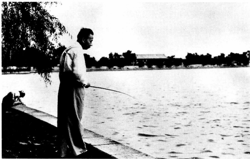
刘少奇主席垂纶，中南海

光美阿姨告诉我说，少奇同志的照片由于底版在“文革”中由新华社等单位负责保管在地库里，万幸没有受到什么破坏。内容丰富的两百多幅照片(包括，“文革”中受到残酷迫害的照片)和两百多件文物引起人们多少酸楚而又崇敬的回忆啊！