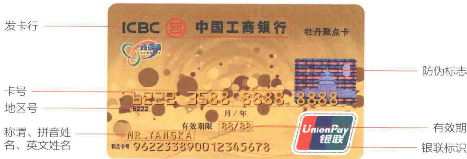
信用卡正面信息图解