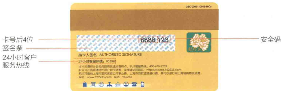
信用卡背面信息图解

信用卡BIN： 现在，信用卡的国际标准是16位卡号，前6位是信用卡的BIN，由国际卡组织分配。信用卡BIN指的是发卡行识别码，英文全称是Bank Identification Number，缩写为BIN，用来表示发卡银行或机构。