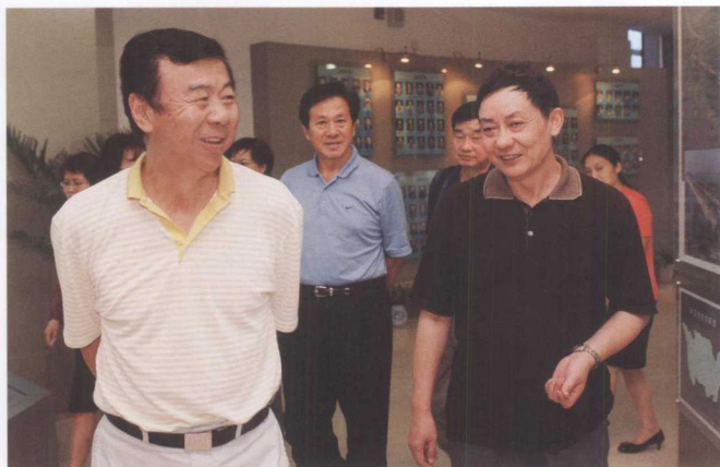
6月23日，全国政协科教文卫体委员会主任袁伟民（左）考察三峡工程