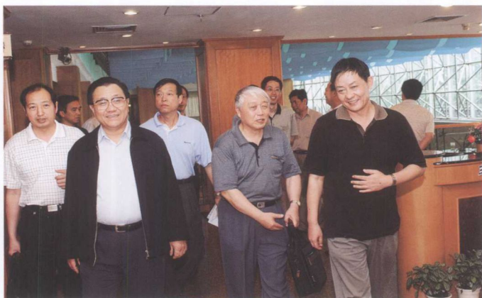
6月27日，国家交通部部长李盛霖（左二）考察三峡工程