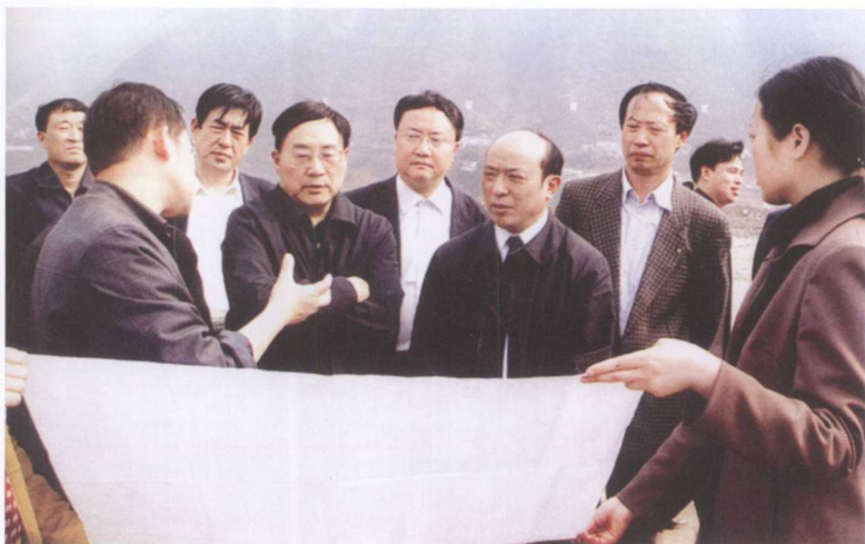
4月25日，国务院三峡办主任蒲海清（右三）在重庆库区视察移民工作