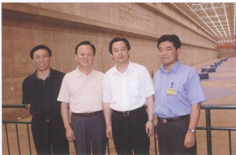
7月16日，北京市副市长陆昊（右二）考察三峡工程