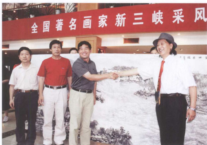
9月8日，以中国美协副主席尼玛泽仁（右一）为团长的全国著名画家新三峡采风团，在结束5天的三峡采风创作后，在三峡工程大酒店举行赠画仪式