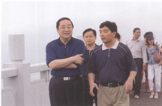
5月5日，中共中央政治局委员、湖北省省委书记俞正声(左)视察三峡工程