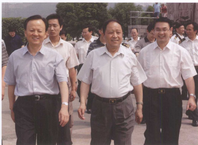
6月1日，国家海关总署署长车新生（右二）考察三峡工程