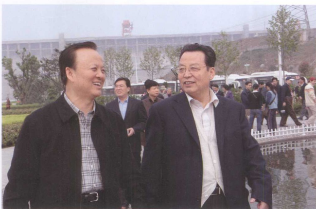
3月31日，国家劳动保障部部长田成 平（右）考察三峡工程