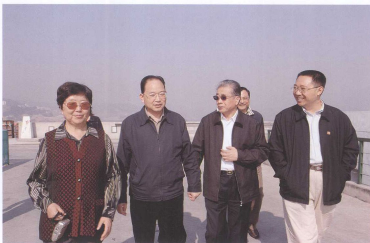
11月6日，中组部副部长、国家人事部部长张柏林（右二）考察三峡工程