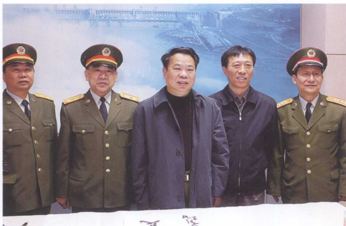
10月31日，成都军区司令员王建民上将（中）考察三峡工程