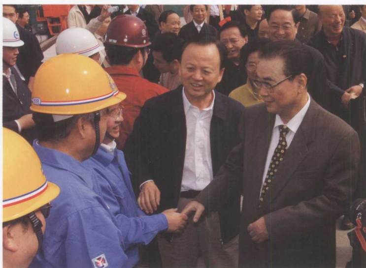
10月26日，全国人大常委会原委员长李鹏(右)视察三峡工程