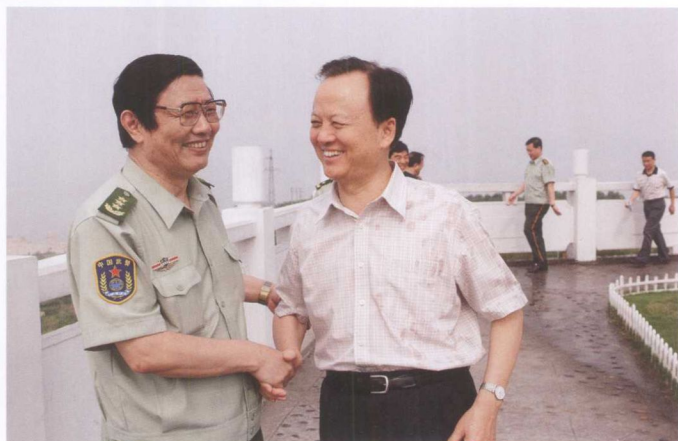
6月2日，武警部队政委隋明太上将（左）考察三峡工程