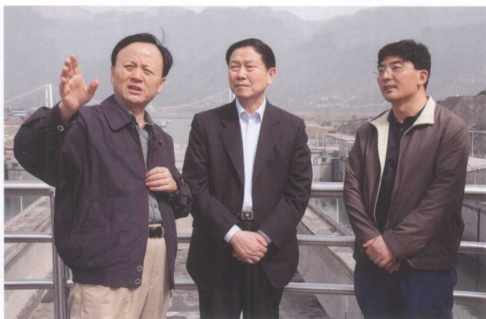
4月23日，国务院国有资产监督管理委员会主任、党委书记李荣融（中）考察三峡工程