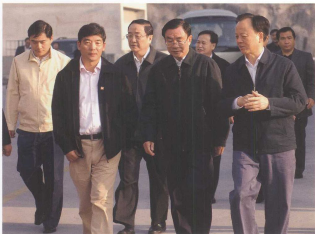
11月6日，中共中央政治局委员、书记处书记、中组部部长贺国强(右二)视察三峡工程