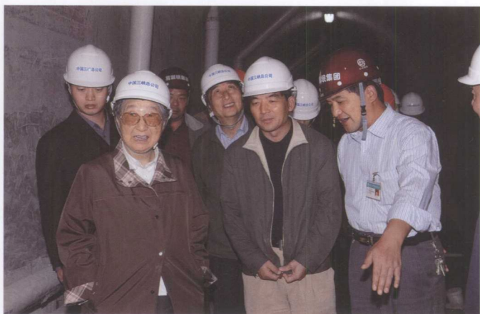
10月30日，全国 政协原副主席钱 正英（左一）视察 三峡工程