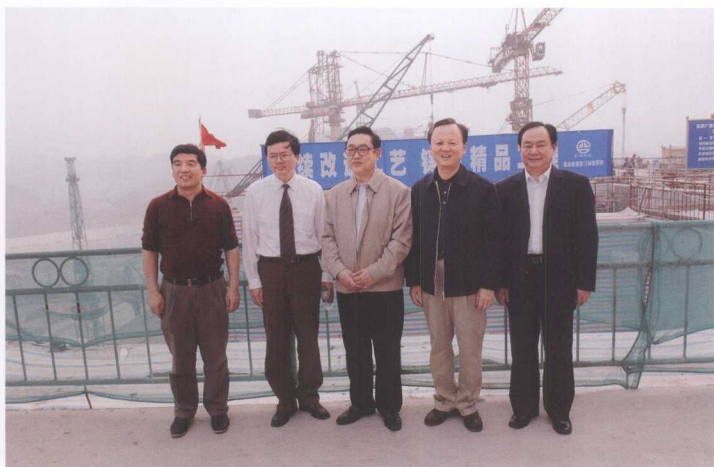
4月10日，国土资源部部长孙文盛（中）考察三峡工程