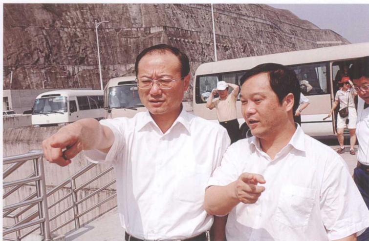
7月20日，国家旅游局局长邵琪伟（左）考察三峡工程