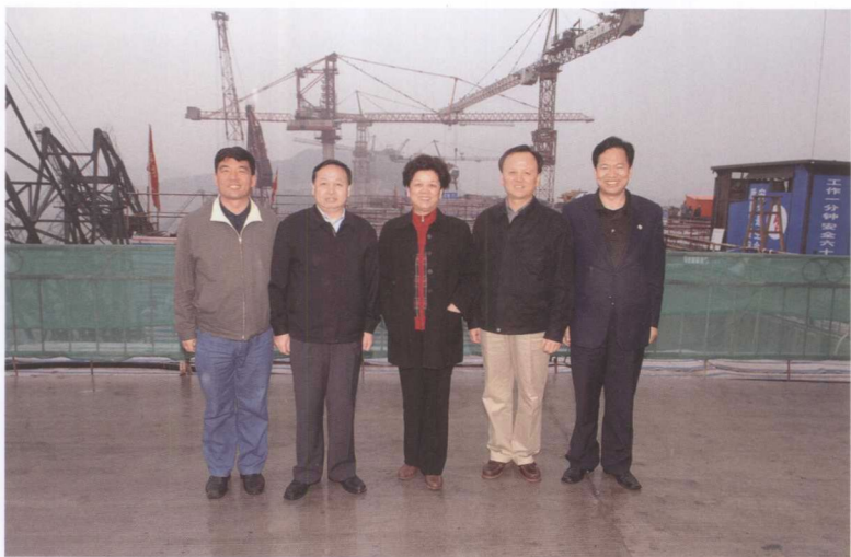
4月12日，国务委员 陈至立（中）视察三 峡工程