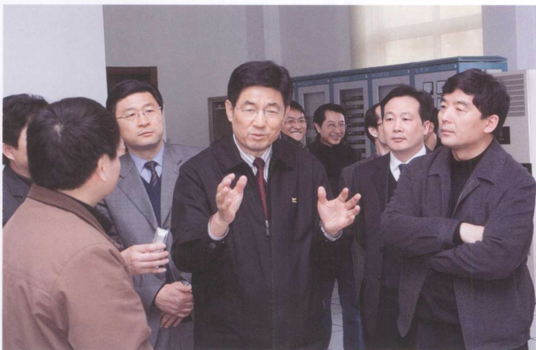
2月25日，新华通讯社社长田聪明（右三）考察三峡工程