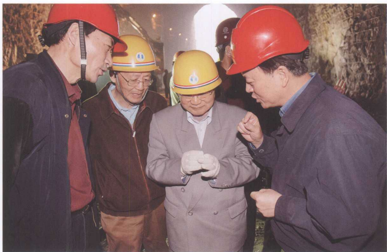
4月2日，三峡工程质量检查专家组一行考察三峡工程