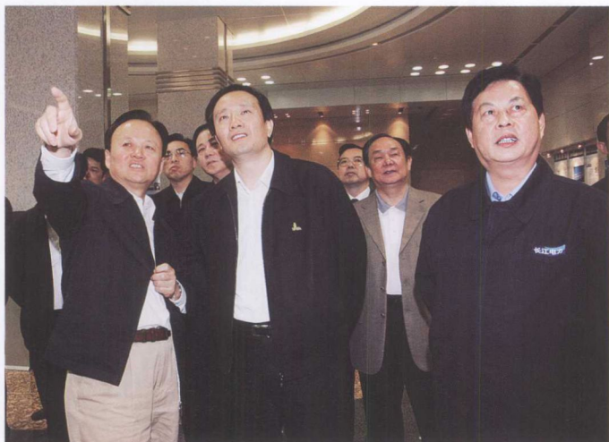
11月5日，中组部副部长李建华（左二）考察三峡工程