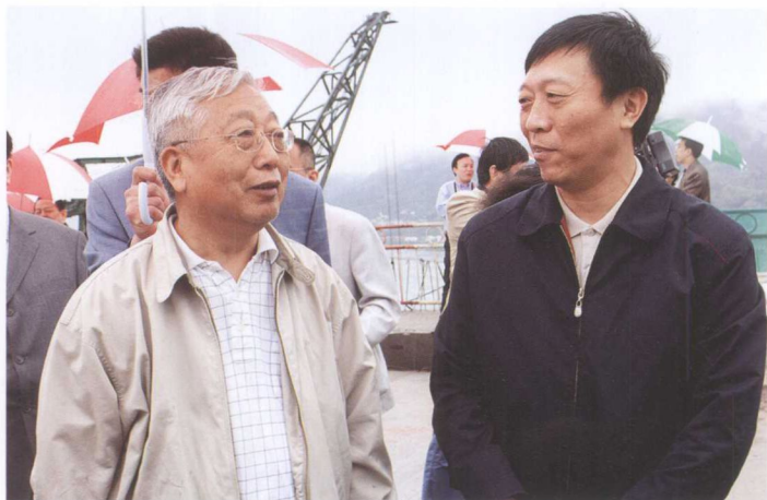
5月12日，全国政协副主 席张思卿（左）视察三峡 工程