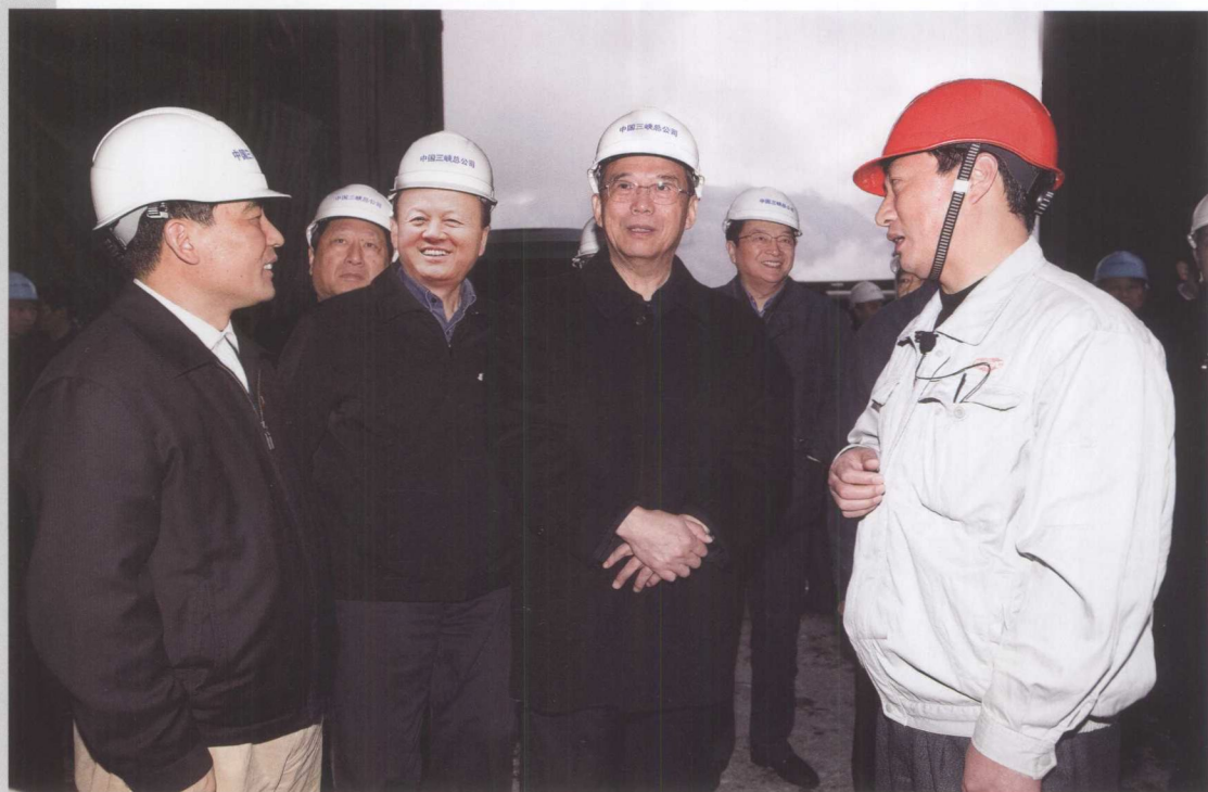
11月25日，中共中央政治局委员、国务院副总理、国务院三峡建委副主任曾培炎(中)视察三峡工程

三峡工程建设一直得到党和国家领导人以及社会各界人士的关注和支持。2006年，考察三峡工程的党和国家领导人及社会各界重要来宾共237批517人次。