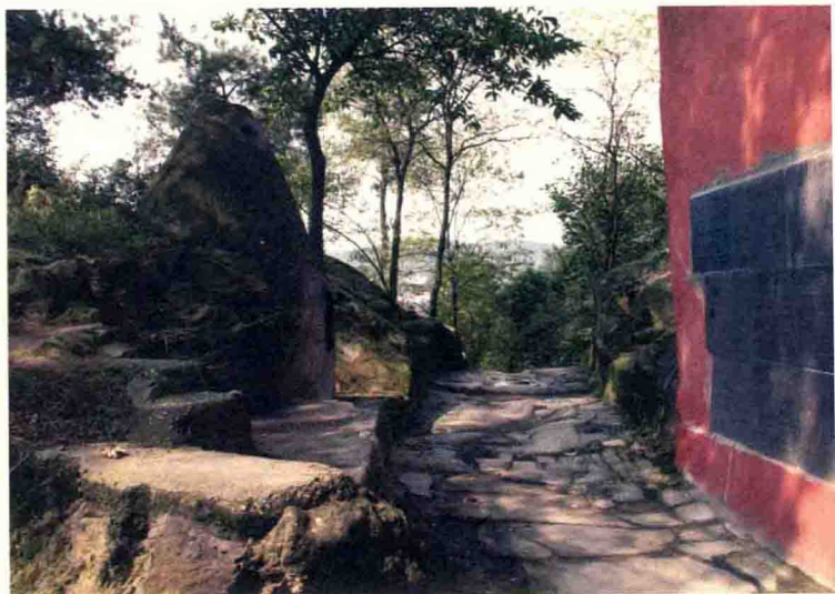
二郎关上面的礅路，旁为观音庙和二郎诸神香位龛