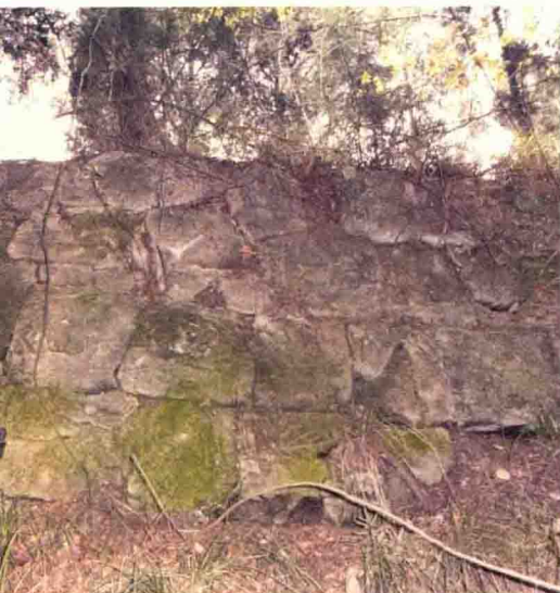
平梁城墙细部——几乎不容置刃