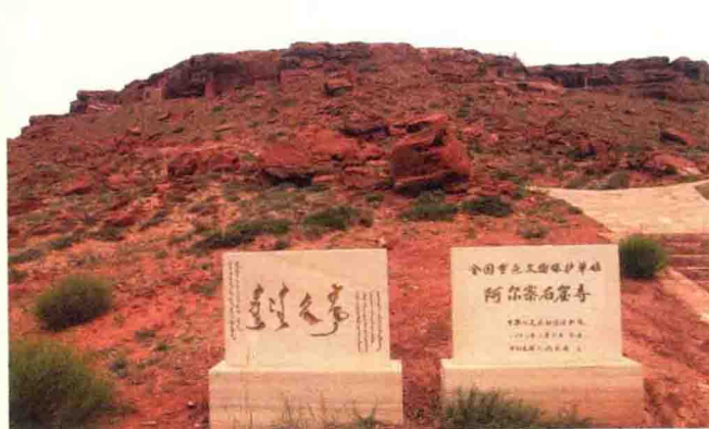
阿尔寨石窟寺保护碑