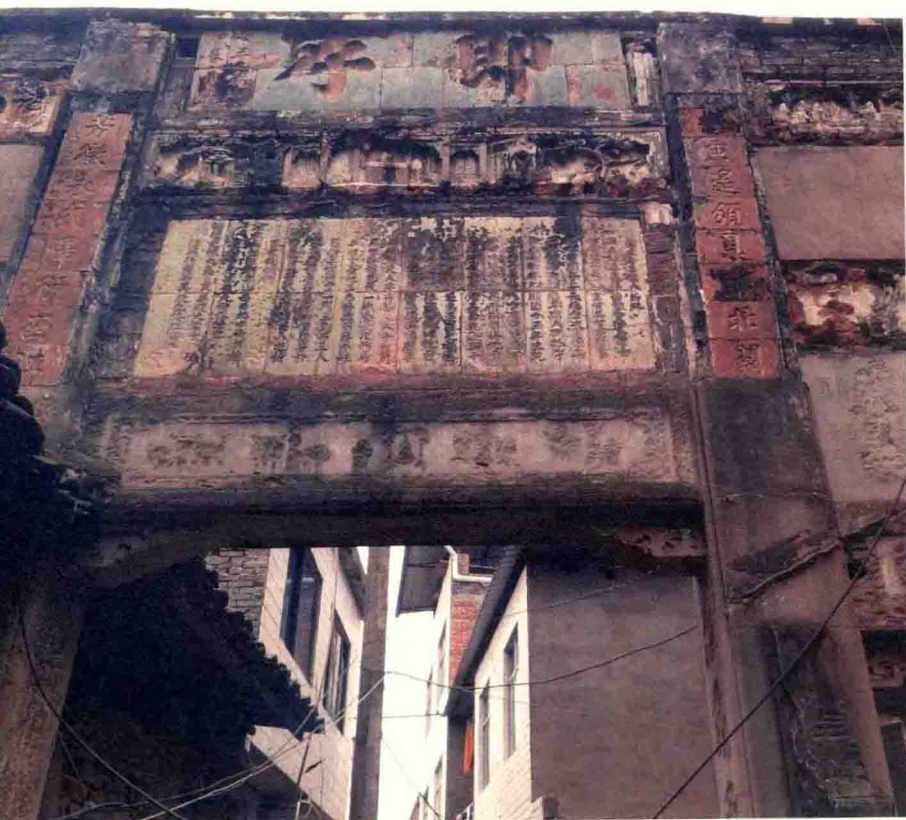
白衣镇白衣庵旁的门洞——曾是商旅过往的要道