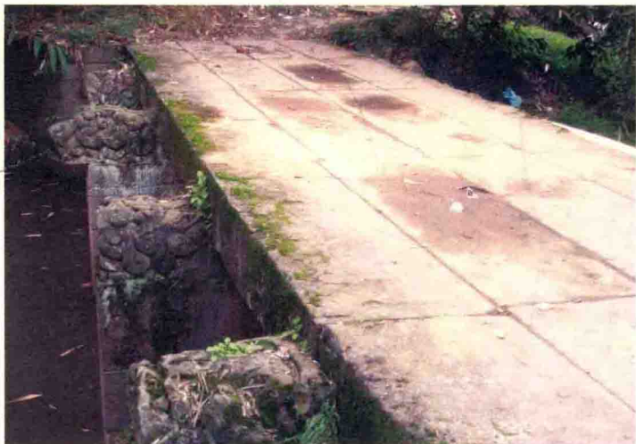
东大路太平镇太平桥