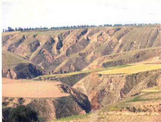
黄土高原的千沟万壑