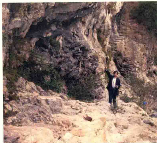
通江县诺水河边悬崖上的阎王碓栈道遗迹