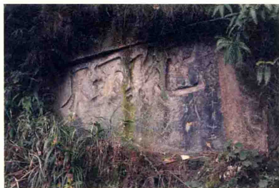
道光年间所刻巴县西界碑