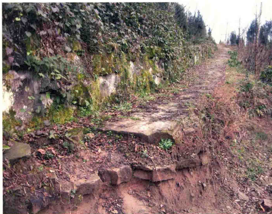
灵应台古道历次重修所铺石板叠压情况