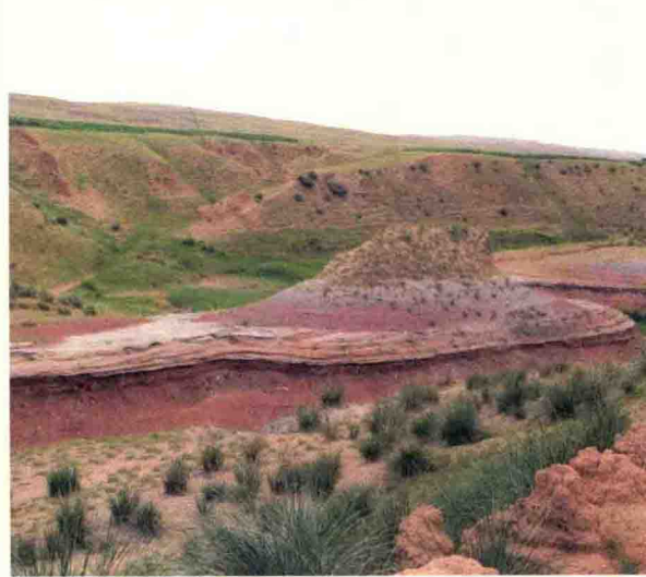
营盘台沟的湖相沉积地层