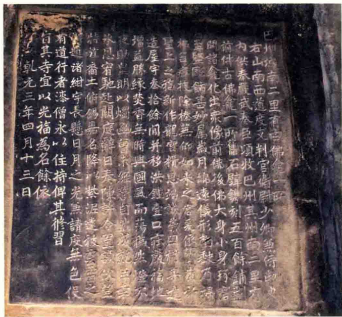
巴州南龕唐乾元三年造像记