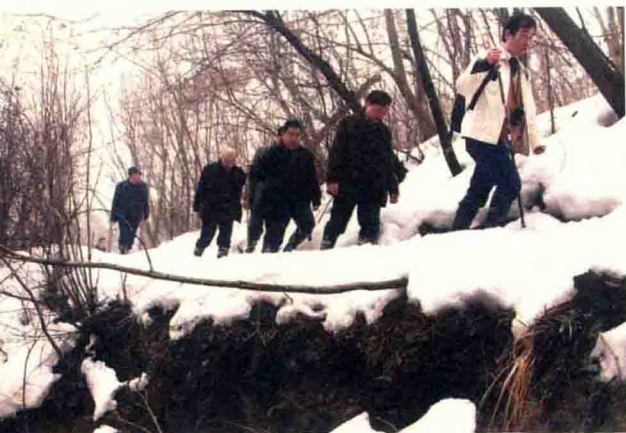
向雪山进发——登顶官仓坪