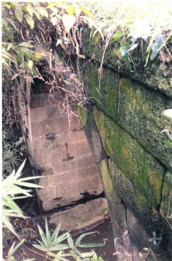
观音阁前的旧石桥