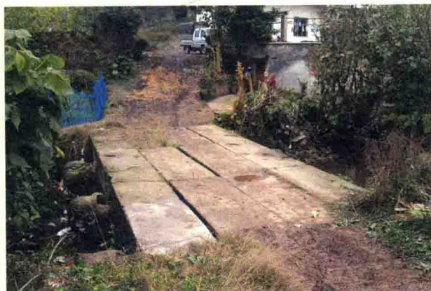
东大路梧桐铺附近的甫子桥