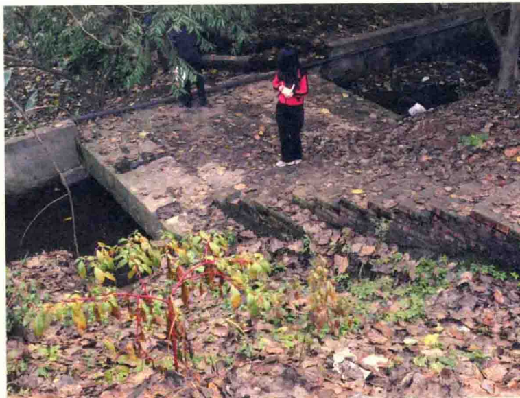
高池铺现存旧石桥