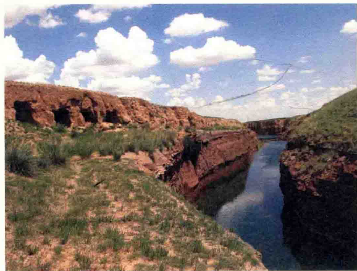
营盘台村旧址和营盘台沟