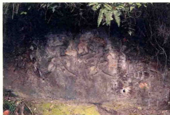
老关口“险设天成”石刻