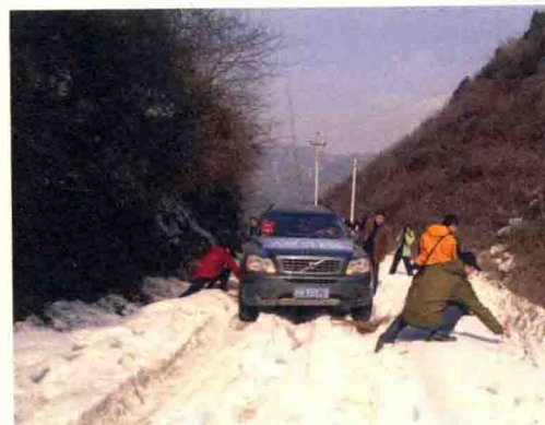
从塘口到庙坝——雪阻米仓山