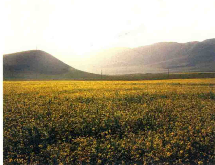
农历六月，山谷间盛开的油菜花，金色梦想之地