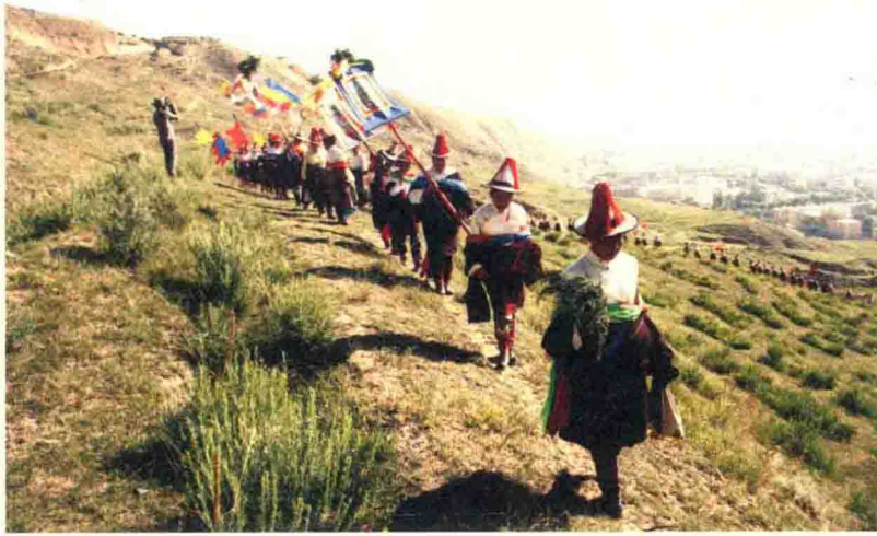
几百人的祭祀队伍像一条长龙， 行进在曲折的山路上。