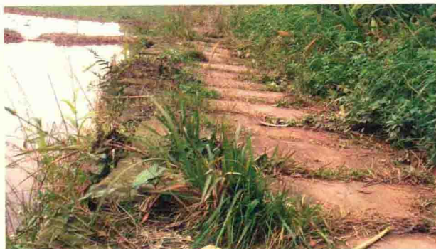
剪刀铺到梧桐间的礅路遗迹