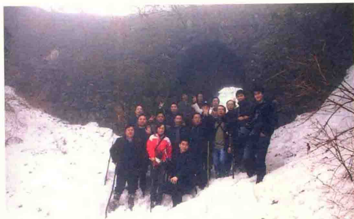
登顶官仓坪17勇士合影