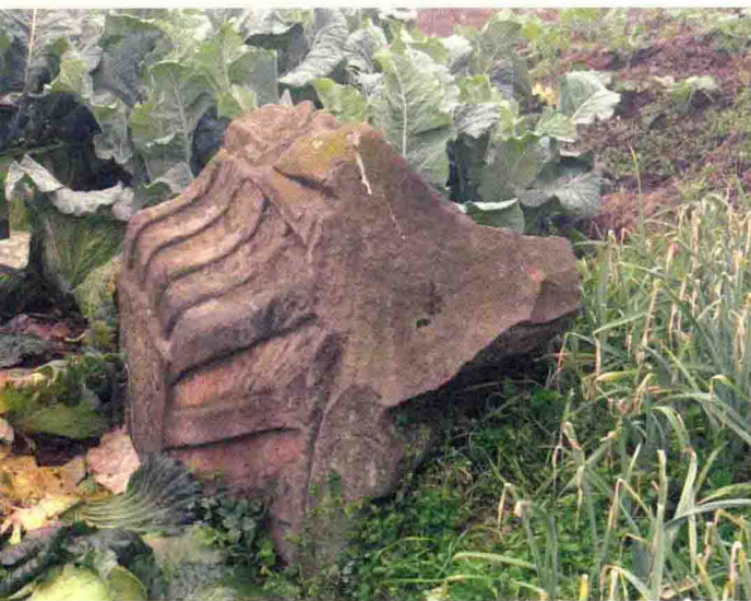
黄墙院子东大路的牌坊构件