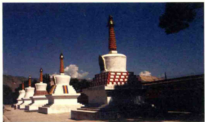
村子的佛寺有如此规模和造诣，可见此地的富庶和人们对宗教的虔诚。