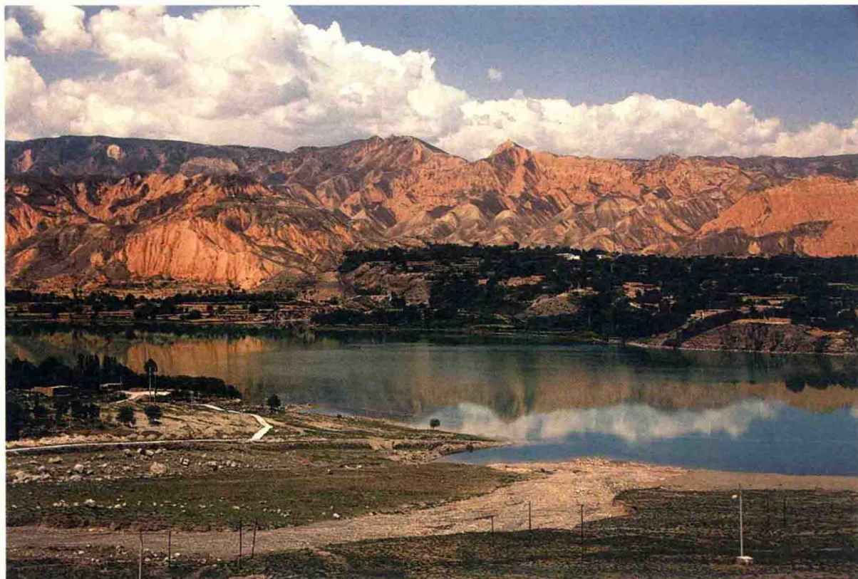
隆务河两岸的绿洲