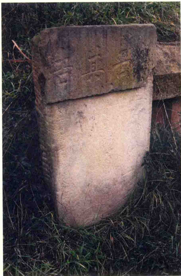
单石铺往太平镇间的旅客墓碑