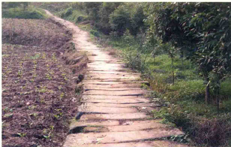
牛尾驿往太平镇的东大路礮路