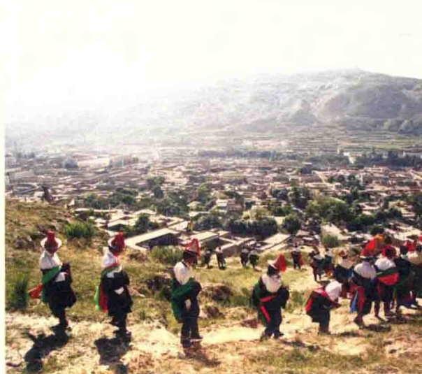
山坡下的四合吉村