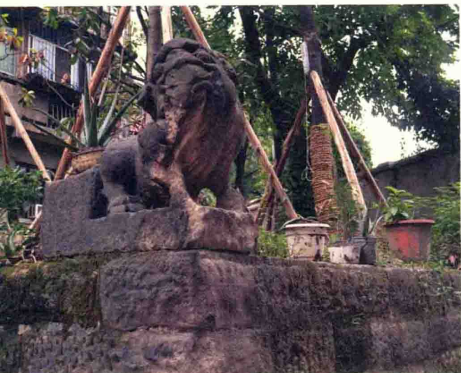
大关门旧址附近的石狮