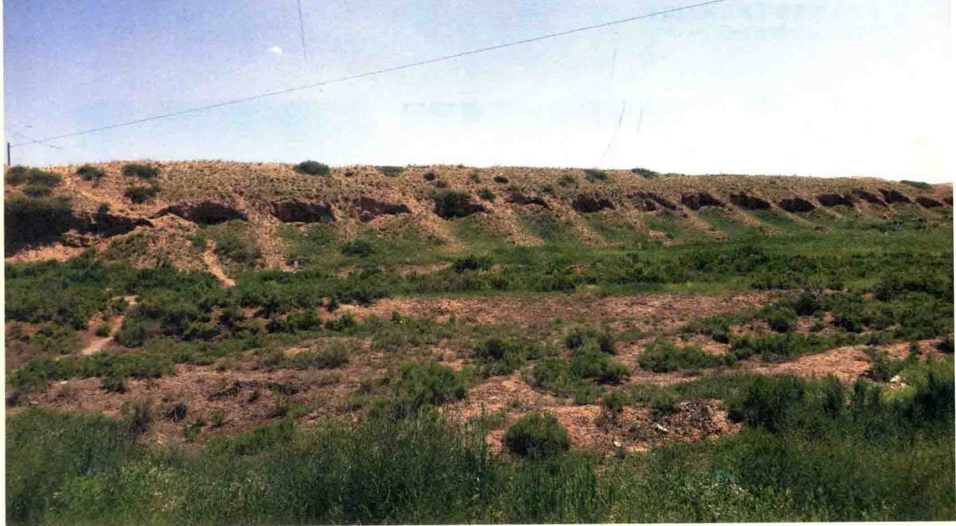
“三五九旅”住过的窑洞遗址