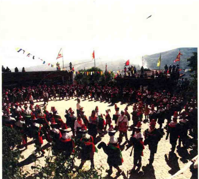
人们在神庙前的坝子上跳起“拉什则”（神舞）