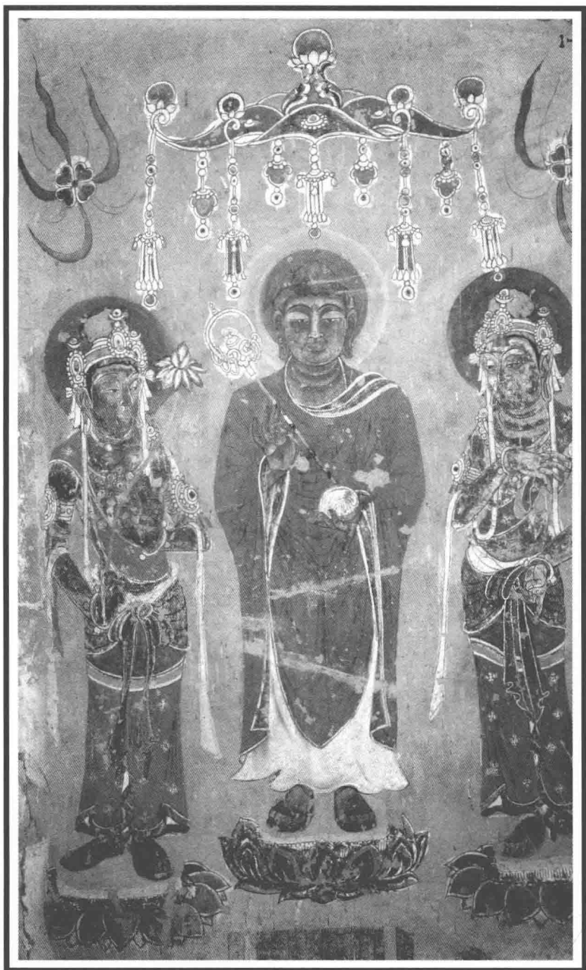
藥師說法古壁畫·莫高窟(初唐)·