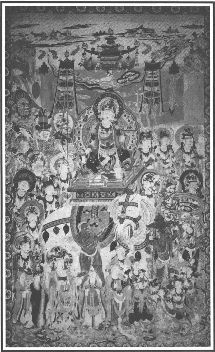
普賢菩薩古壁畫·莫高窟(中唐)·