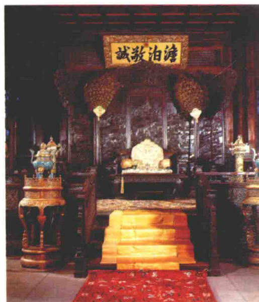
△ “澹泊敬诚”殿（俗称“楠木殿”）