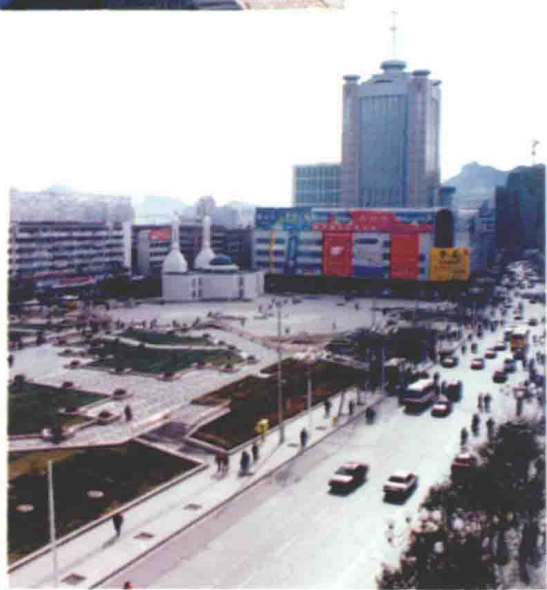
△ 承德市中心广场和广场一角的东清真寺