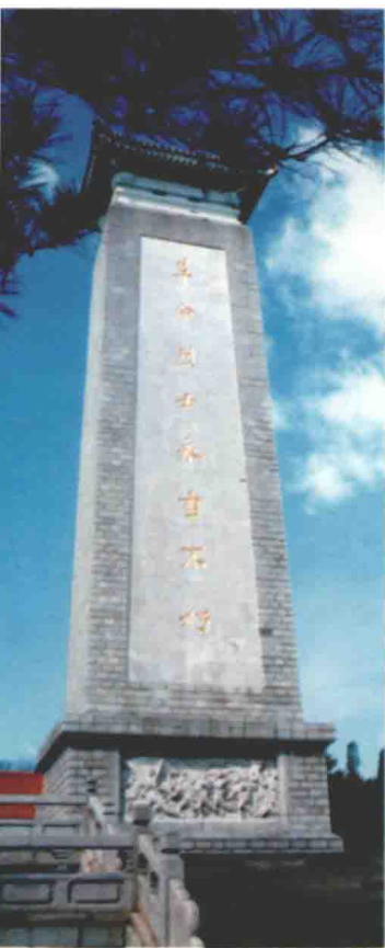
热河革命烈士纪念碑