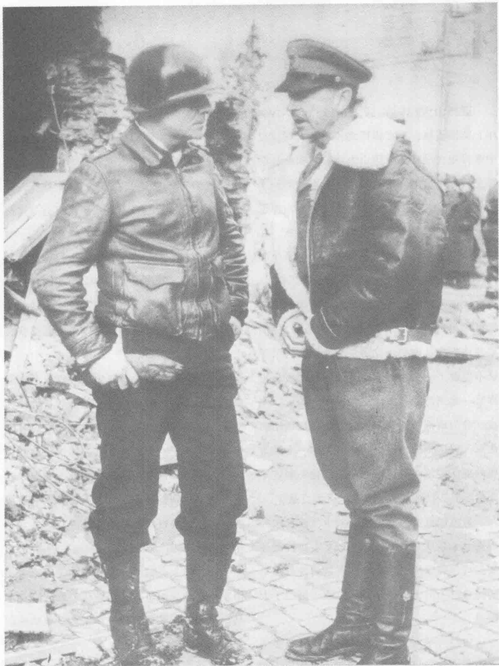
■ 意大利盟军总司令亚历山大将军(右)在同美国将军特洛斯考特谈话,1944年,于被战争破坏的城镇尼特困诺。