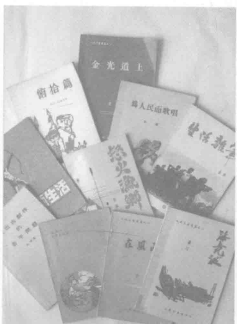
封面设计简朴的工人小说