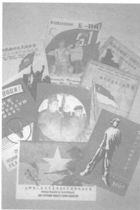
斗红斗专的左翼工会特刊