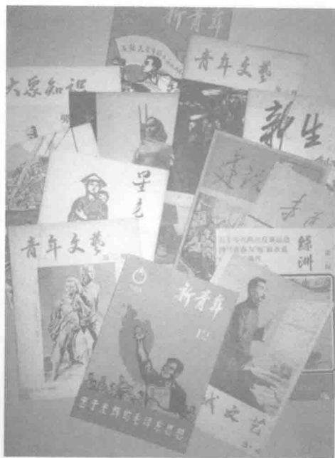
以无产阶级斗争为封面的左翼杂志