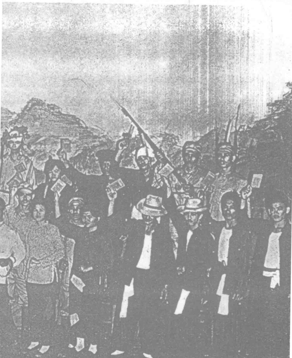
改编成话剧的《红灯记》，由金银业工联在会庆上演