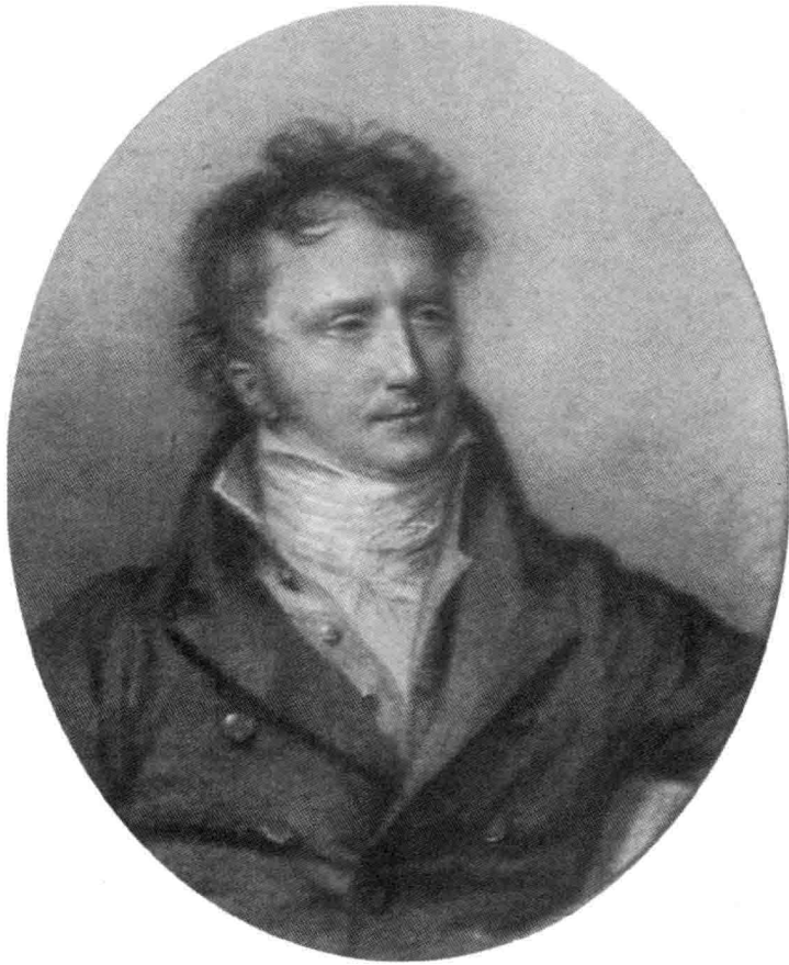
图一：邦雅曼·贡斯当三十余岁时之肖像 ①