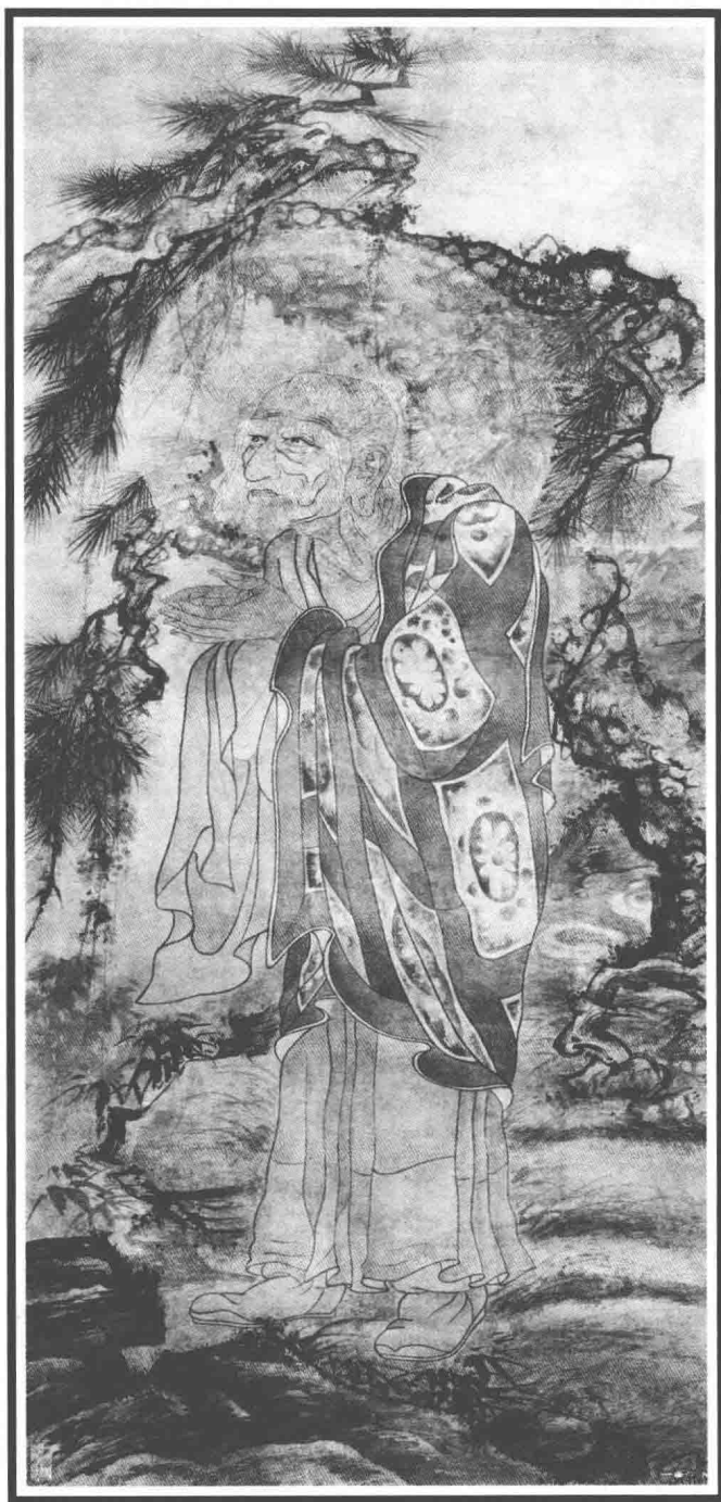
达摩图·丁觀鹏（清朝）