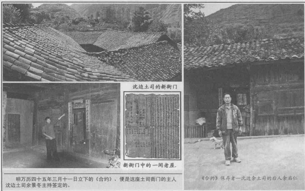
沈边土司的新衙门