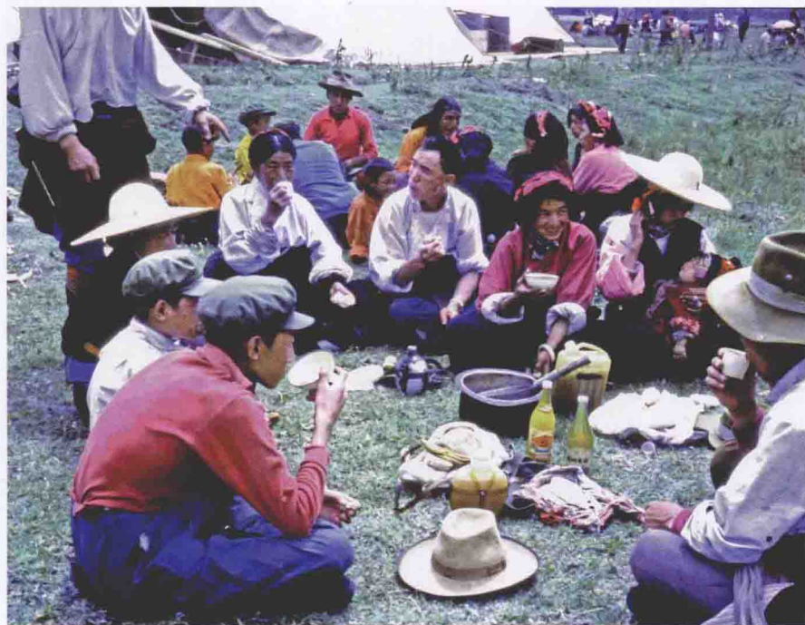
赛马会上亲朋好友野外相聚,少不了酥油茶和美酒