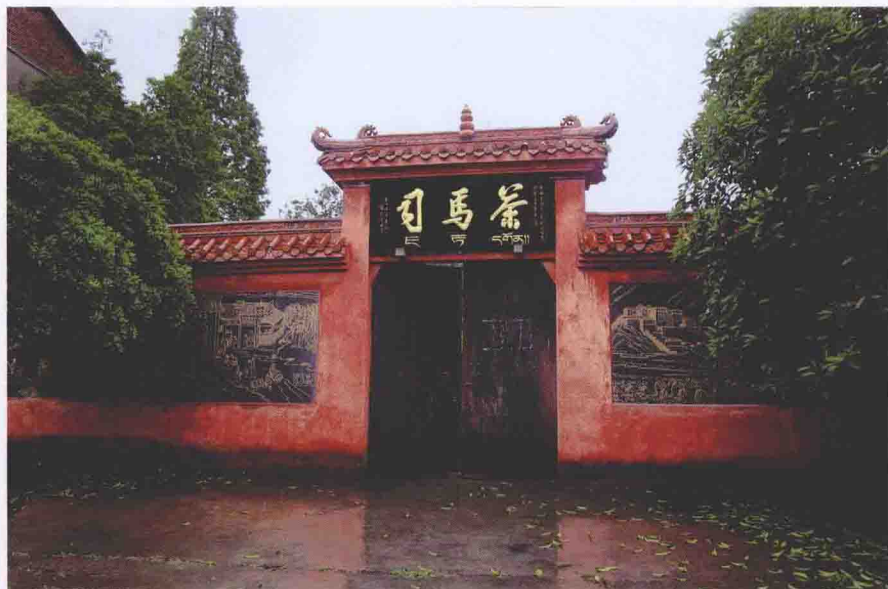
至今仍能见到的坐落在名山新店的茶马司遗址