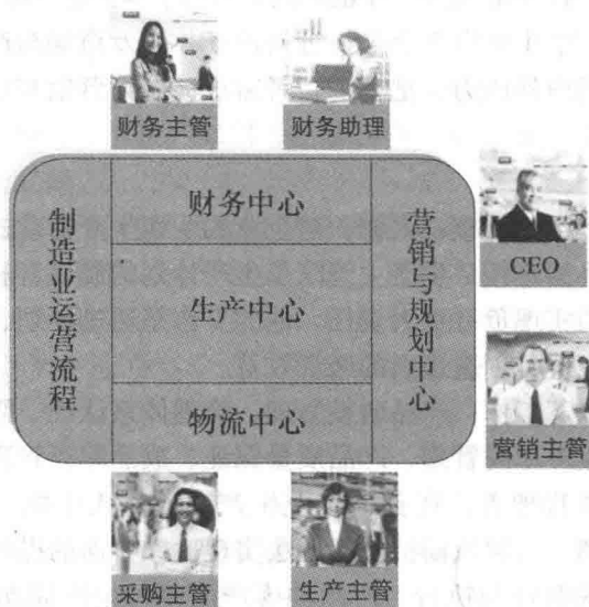
图 1-1 主要角色盘面定位图